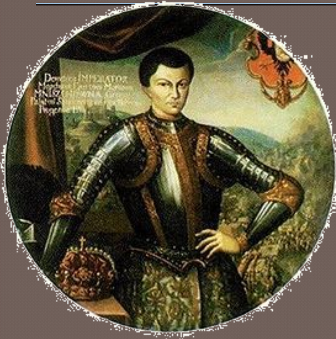
Лжедмитрий I (Дмитрий Иванович)

В 1601г. Григорий Отрепьев он же (Лжедмитрий) начал идти к Москве , провозгласив себя чудо спасшимся царевичем Дмитрием. Подготовили его Польский Король и Мария Мнишек (дочь Короля)