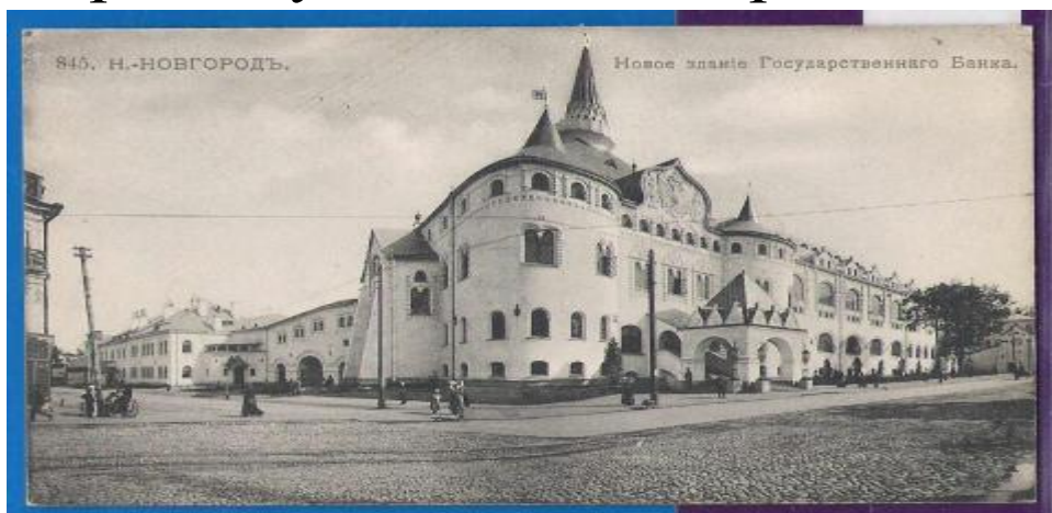
Державний банк Росії

З 1897 по 1914 р. насправді в Росії не було банкнотного обігу, а був обіг золотих сертифікатів. Держбанк фактично майже ніколи повністю не ви Про нераціональність будови грошової системи свідчить також висока питома вага в обігу золота порівняно з кредитними білетами, що збільшувало непродуктивні витрати обігу. Крім того, Держбанк змушений був утримувати непродуктивно понад мільярдний запас золота для забезпечення порівняно невеликої кількості кредитних білетів в обігу. користовував емісійне право.