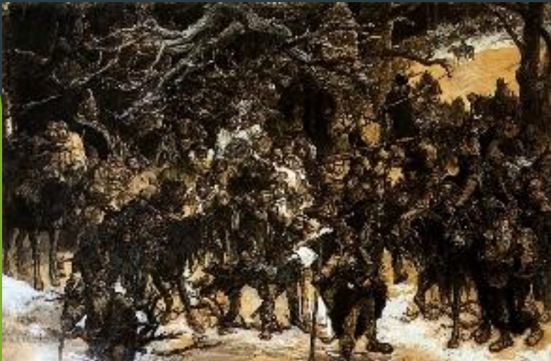
Михал Эльви́ро Андриолли , "Возвращение литовцев", 1892. Национальный музей Варшавы.