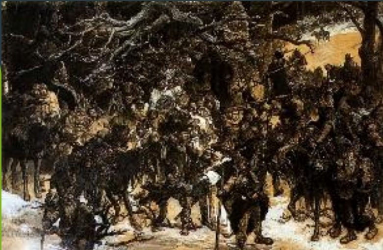
Михал Эльви́ро Андриолли , "Возвращение литовцев", 1892. Национальный музей Варшавы.