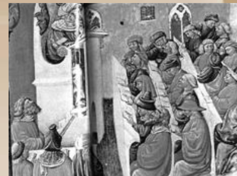
Студенты университетской аудитории (Германия, XIV век)