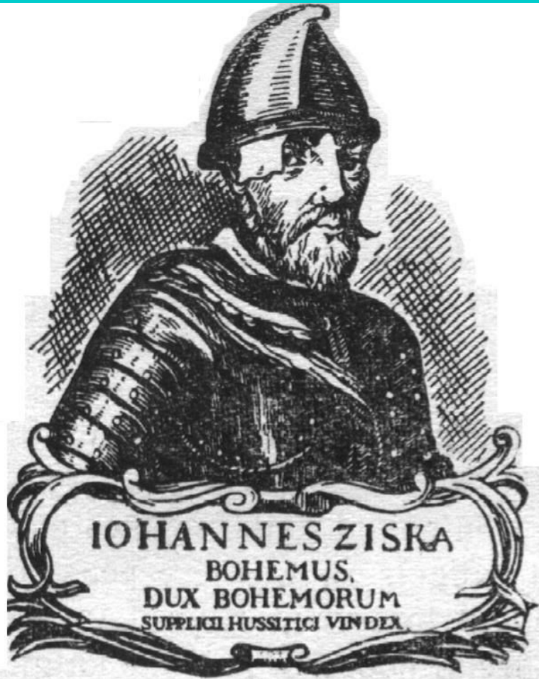
Ян Жижка. Гравюра 15 в.

Во главе таборитов встал Ян Жижка-разорившийся рыцарь.