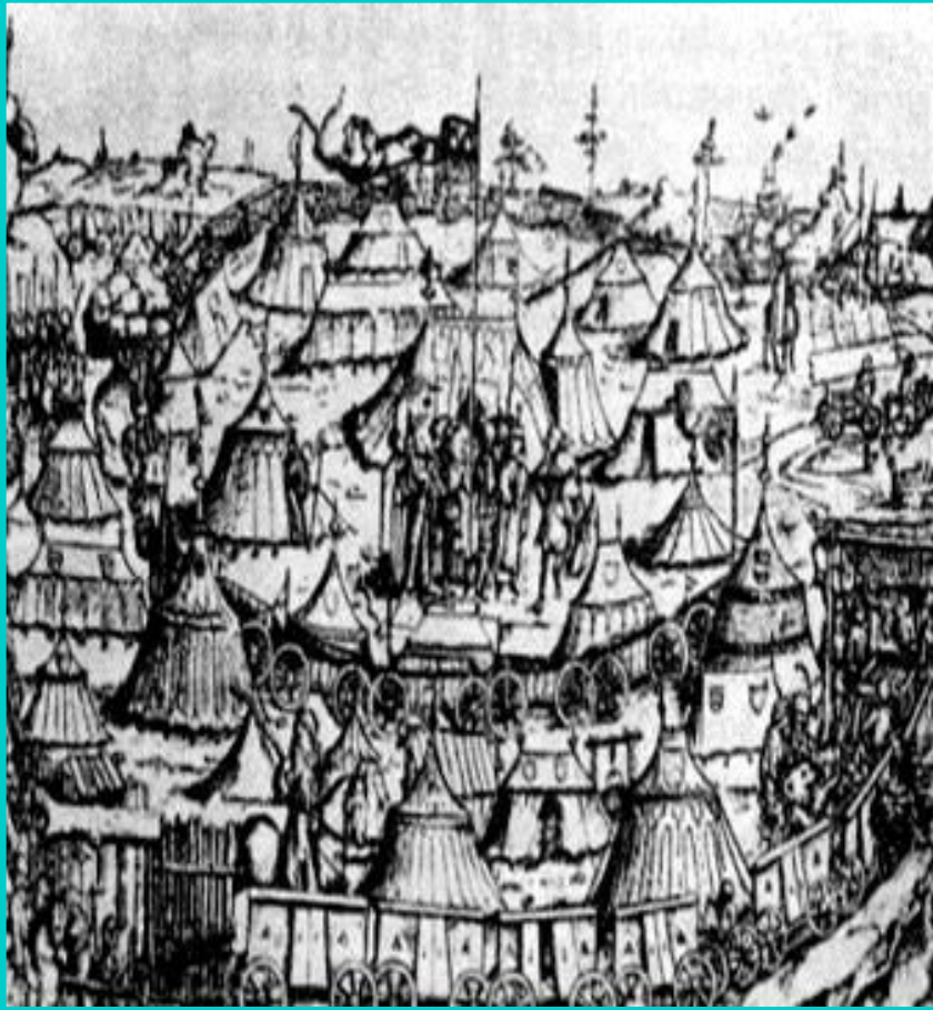
Лагерь таборитов. Гравюра 15 в.

В 1434 г. у г.Липаны умеренные атаковали таборитов и выманив их из-за возов,разгромили.