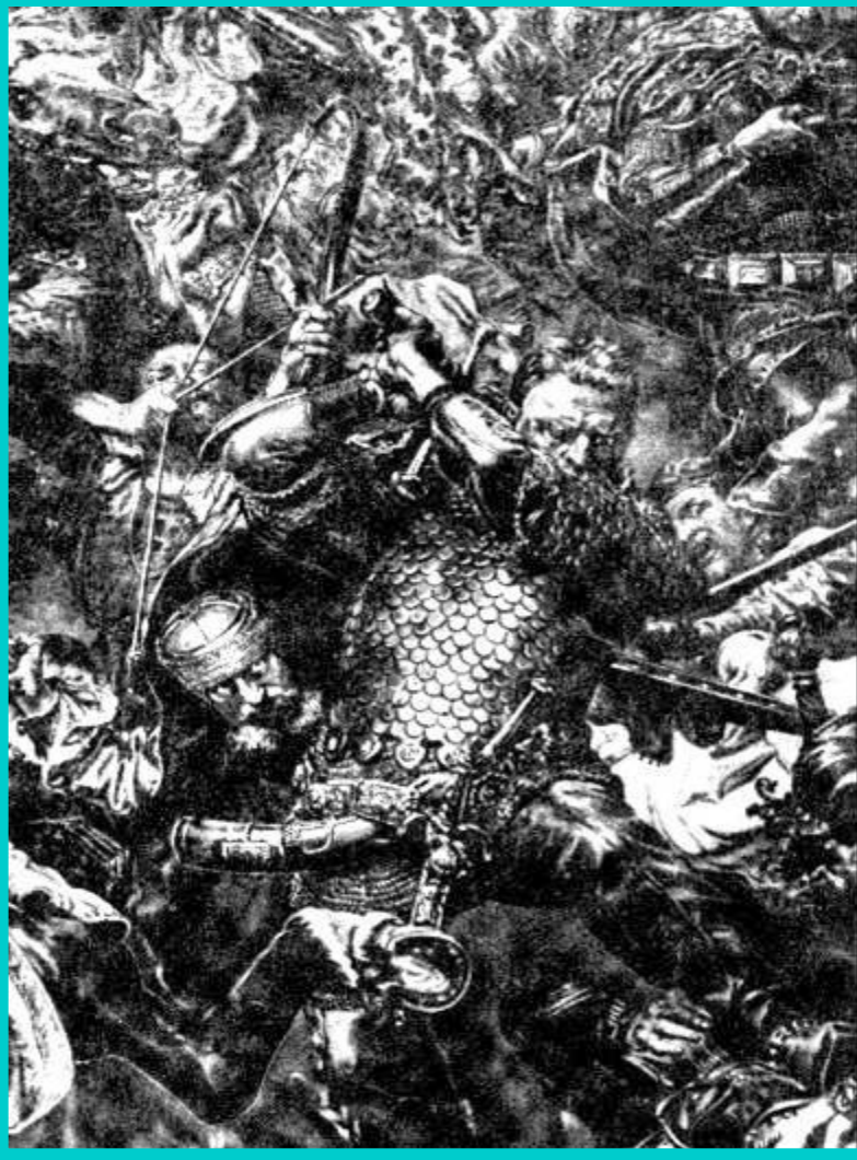
Ян Жижка в бою. Гравюра 15 в.

Жижка часто появлялся там где его не ждали.