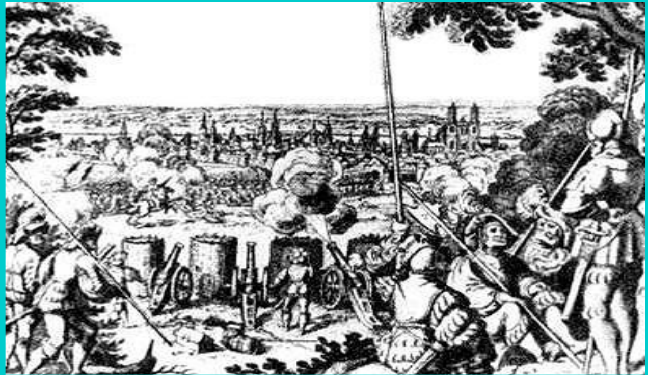
Табориты в осаде. Гравюра 15 в.

Во время войны умеренные и табориты поссорились-умеренные захватили земли церкви и управление в городах. Папа и император начали с ними переговоры,обещая оставить земли и сохранить новый порядок в церкви. Умеренные начали борьбу с таборитами.