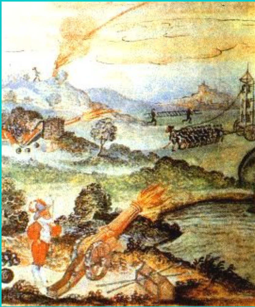
Оборона Праги. Миниатюра 15 в.

Против гуситов выступил сам Папа Римский, объявив крестовый поход.