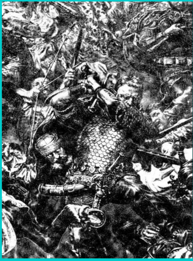
Ян Жижка в бою. Гравюра 15 в.

Жижка часто появлялся там где его не ждали.