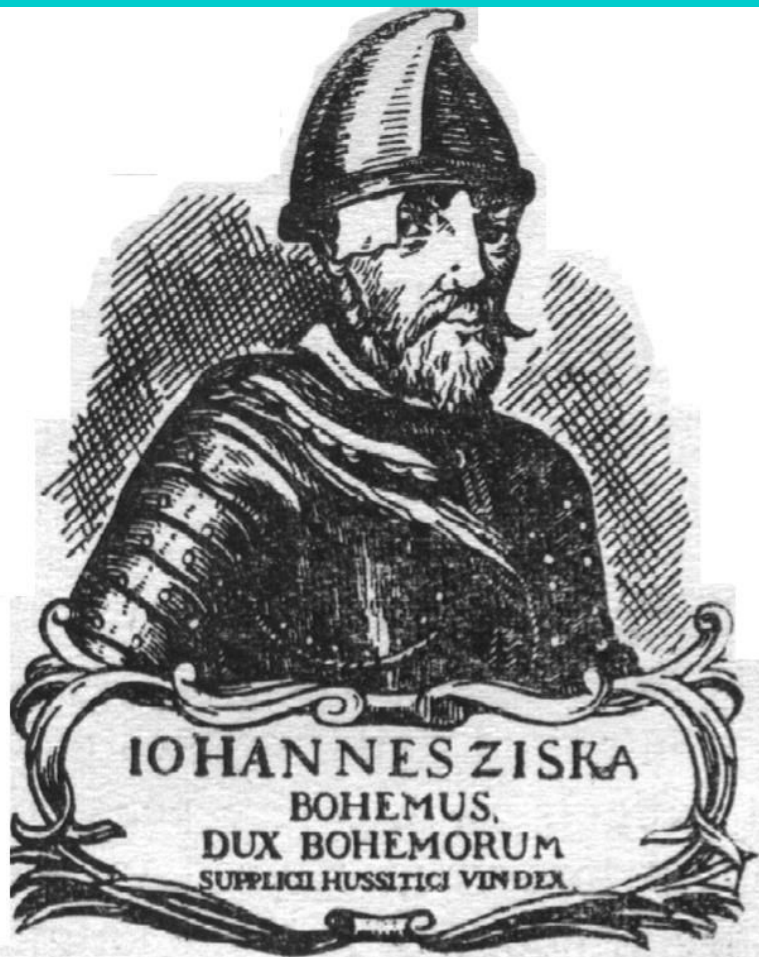
Ян Жижка. Гравюра 15 в.

Во главе таборитов встал Ян Жижка-разорившийся рыцарь.