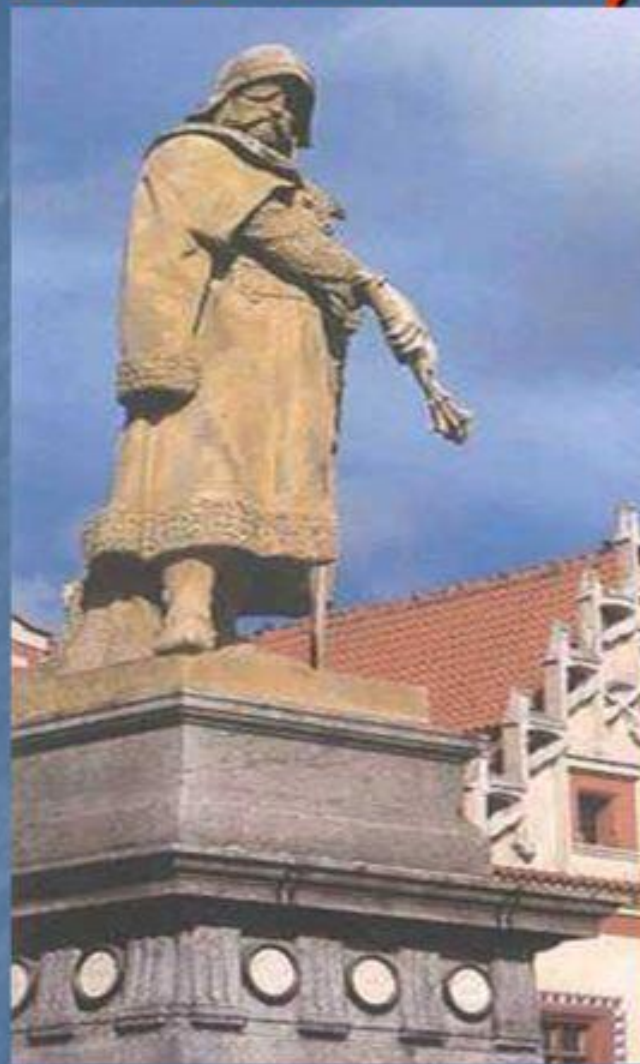
■ Памятник Я.Жижке в Таборе