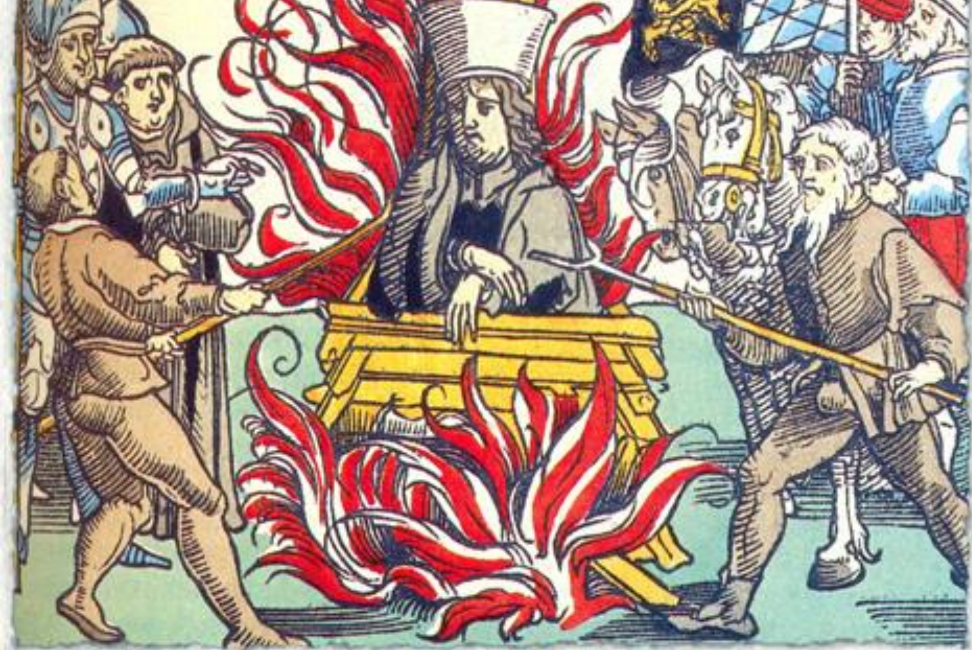
1415 г. Сожжение Яна Гуса. Раскрашенная гравюра из издания "Хроники Констанцкого собора" фон Рихенталя 1483 года.