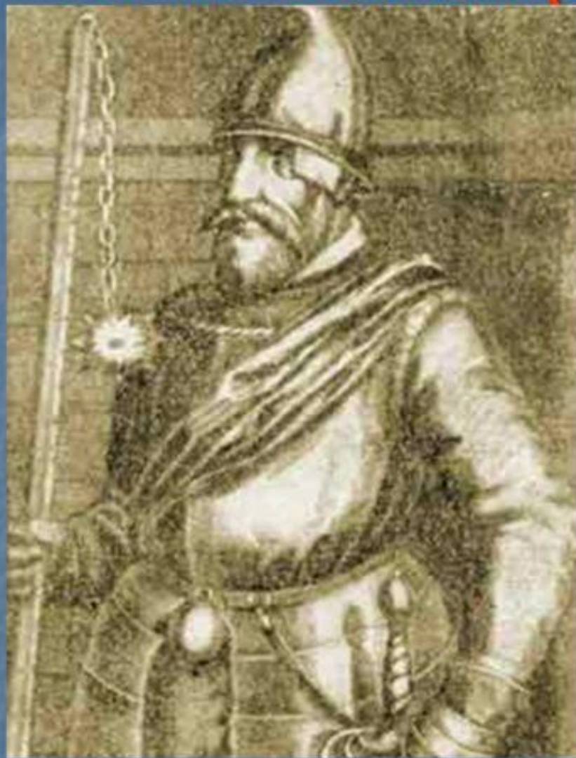
■ Ян Жижка