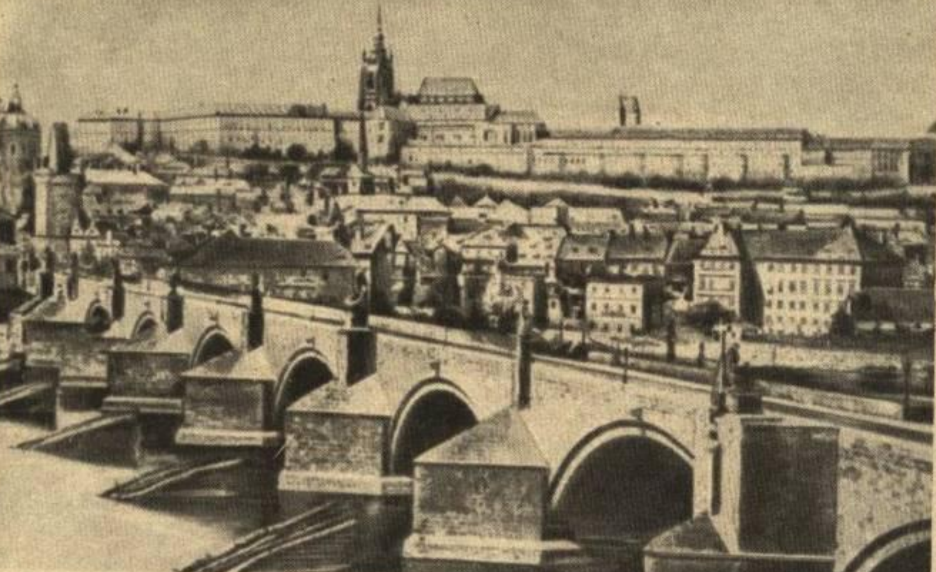
Вид Праги. На переднем плане – мост через реку Влтаву. Вдали – Пражский Кремль.