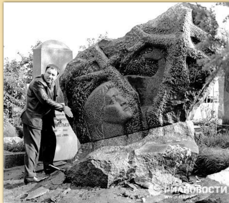
Надгробие писательнице Галине Николаевой

Скончалась Галина Евгеньевна Николаева 18 октября 1963 года в Москве, похоронена на Новодевичьем кладбище