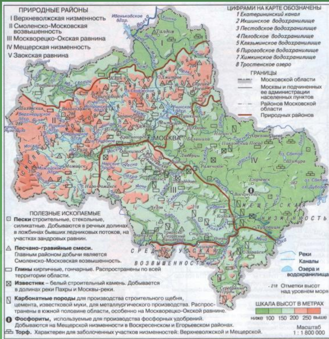
Природные районы и полезные ископаемые Московского региона