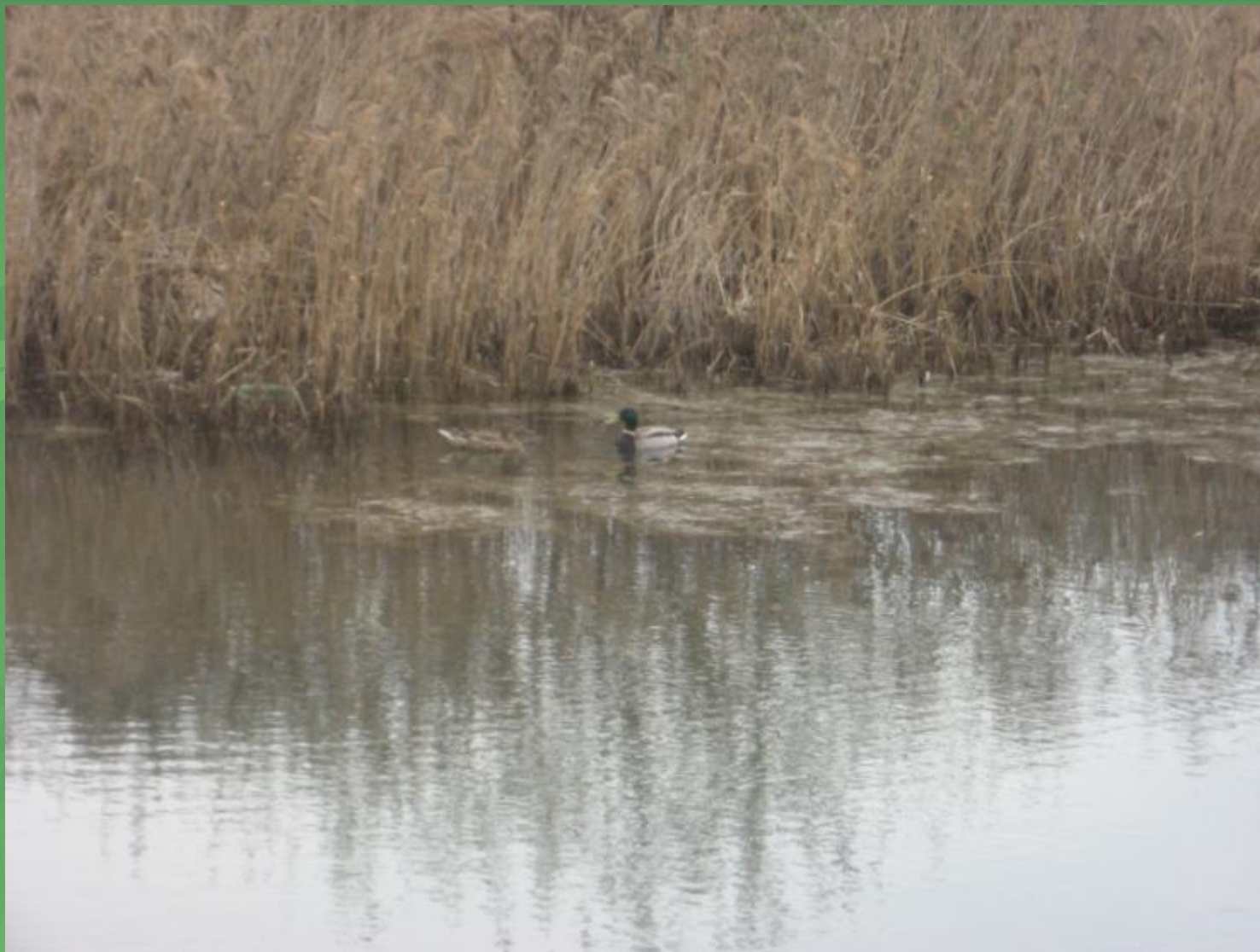
Озёра Одинцовского района