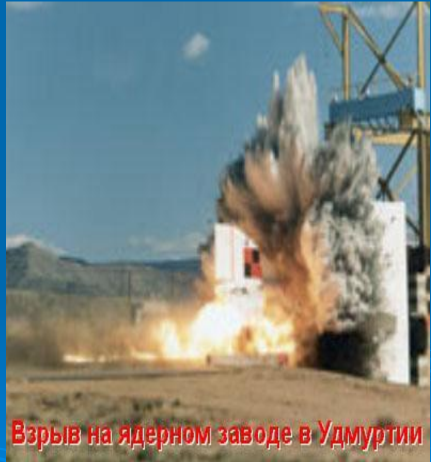
Взрыв на ядерном заводе в Удмуртии