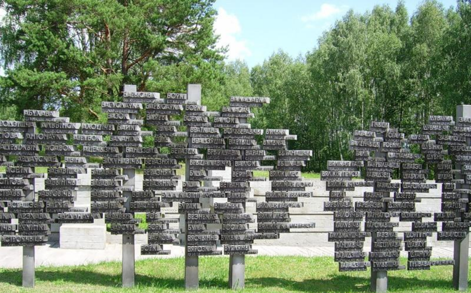
Трагедия Хатыни повторилась в 433 белорусских деревнях, Они были возрождены после войны и увековечены на элементе мемориала «символические деревья жизни». На символических ветвях деревьев в алфавитном порядке перечислены названия 433 белорусских деревень, которые были уничтожены фашистами вместе с жителями, но восстановлены после войны.