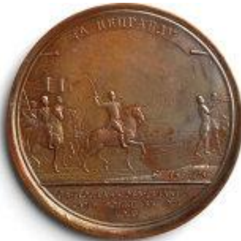
Монеты, найденные при раскопках столицы Итиль