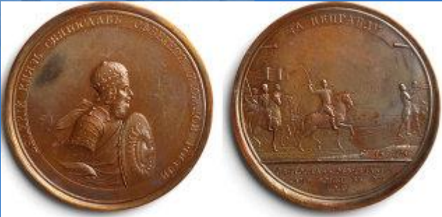
Монеты, найденные при раскопках столицы Итиль