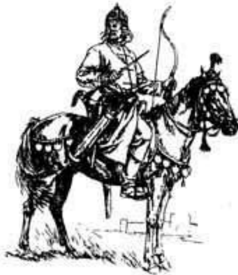
1 Хазарские воины 2