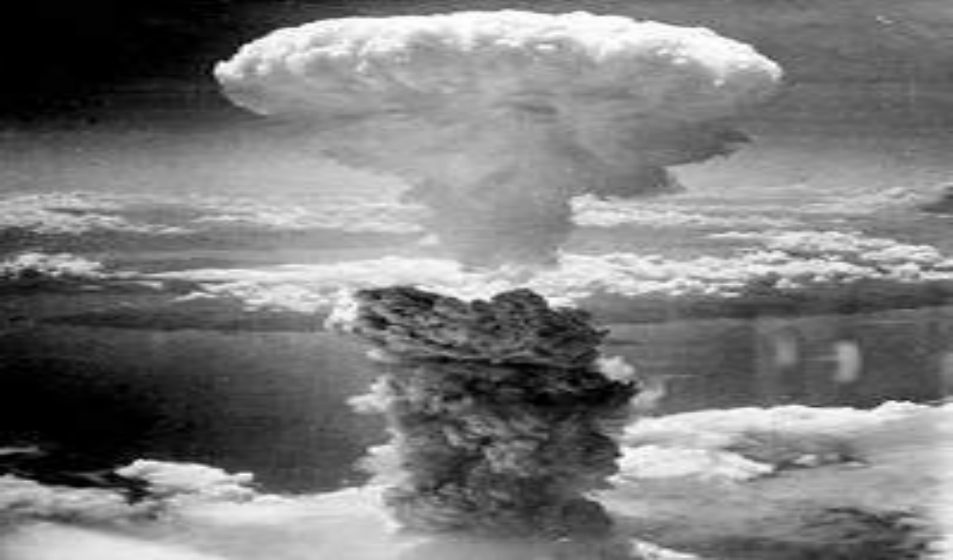
Ядерный гриб над Нагасаки