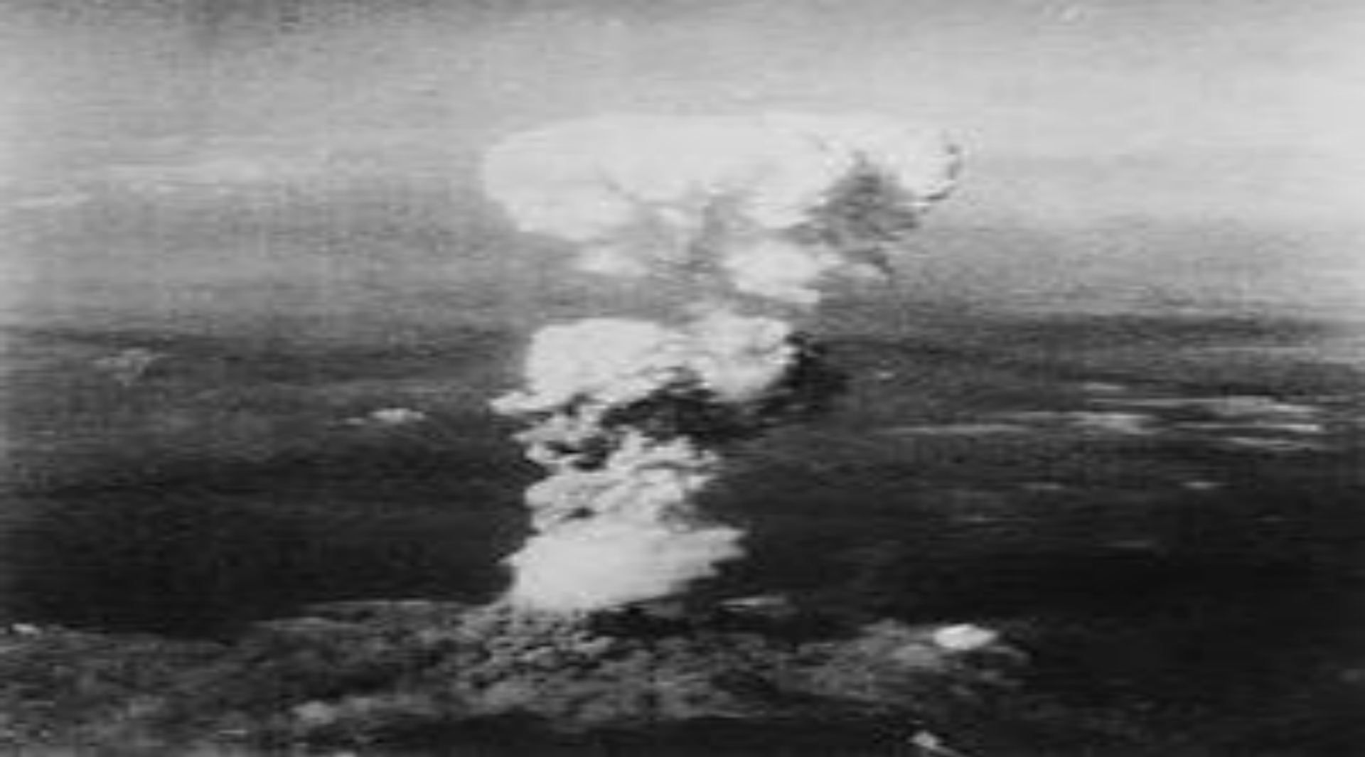
Ядерный гриб над Хиросимой