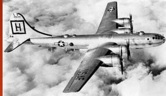
бомбардировщик В-29, США