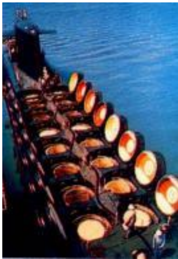
Американская атомная подлодка «Наутилус»

Но в 1949 г. Советский Союз успешно провел испытание своей ядерной бомбы. В 1952 г. американцы испытывают термоядерное устройство.