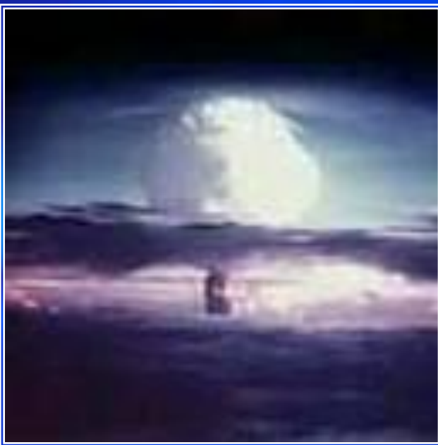
Взрыв атомной бомбы

Между союзниками по антигитлеровской коалиции существовали глубокие различия, связанные с различными социальными системами.