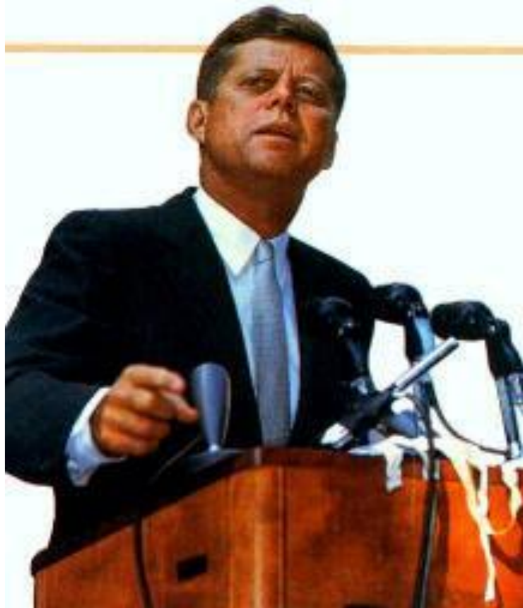
Обращение Дж. Кеннеди к нации

Мир оказался на грани третьей термоядерной войны. Стратегические силы в СССР и в США были приведены в состояние полной боевой готовности.