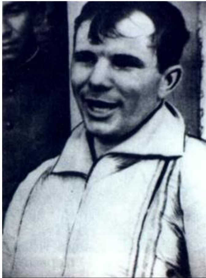
Ю.А. Гагарин после полета

Новый виток противостояния был связан с освоением космоса. В 1957 г. СССР осуществил запуск 1-го искусственного спутника Земли. Американцы сделали это в 1958 г.