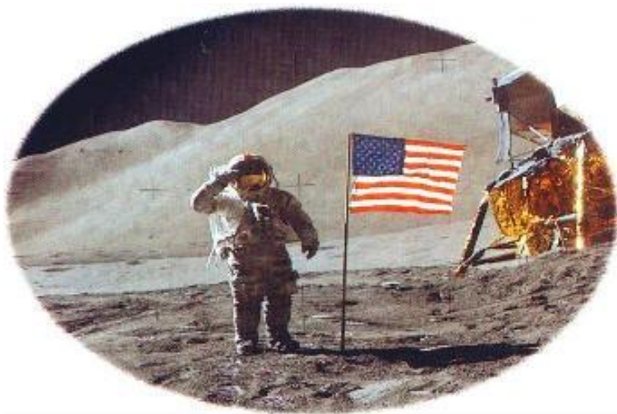
Н. Армстронг на Луне

Карибский кризис стал серьезным уроком для лидеров сверхдержав. «Холодная война» пошла на спад.