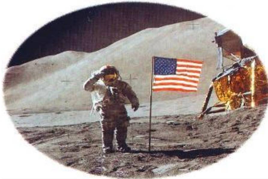
Н. Армстронг на Луне

Карибский кризис стал серьезным уроком для лидеров сверхдержав. «Холодная война» пошла на спад.