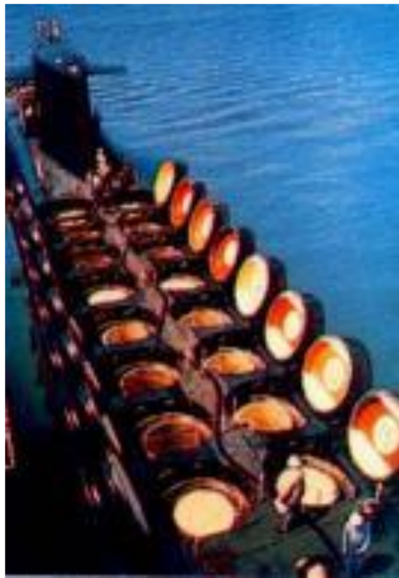
Американская атомная подлодка «Наутилус»

Но в 1949 г. Советский Союз успешно провел испытание своей ядерной бомбы. В 1952 г. американцы испытывают термоядерное устройство.