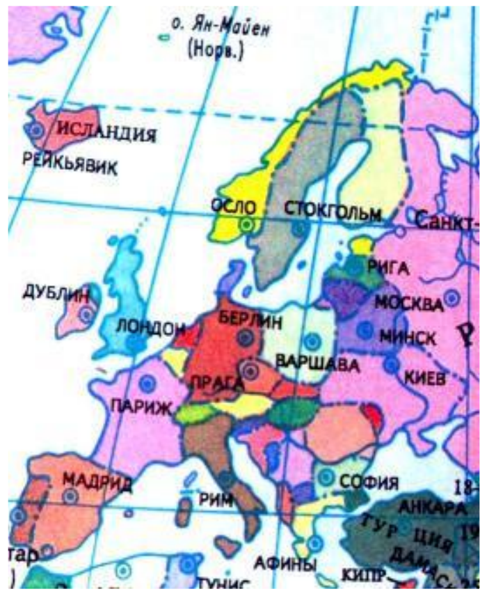
Карта Европы в начале 90-х гг.

Многие слои населения от начавшихся реформ проиграли, а Восточная Европа оказалась в зависимости от Запада.