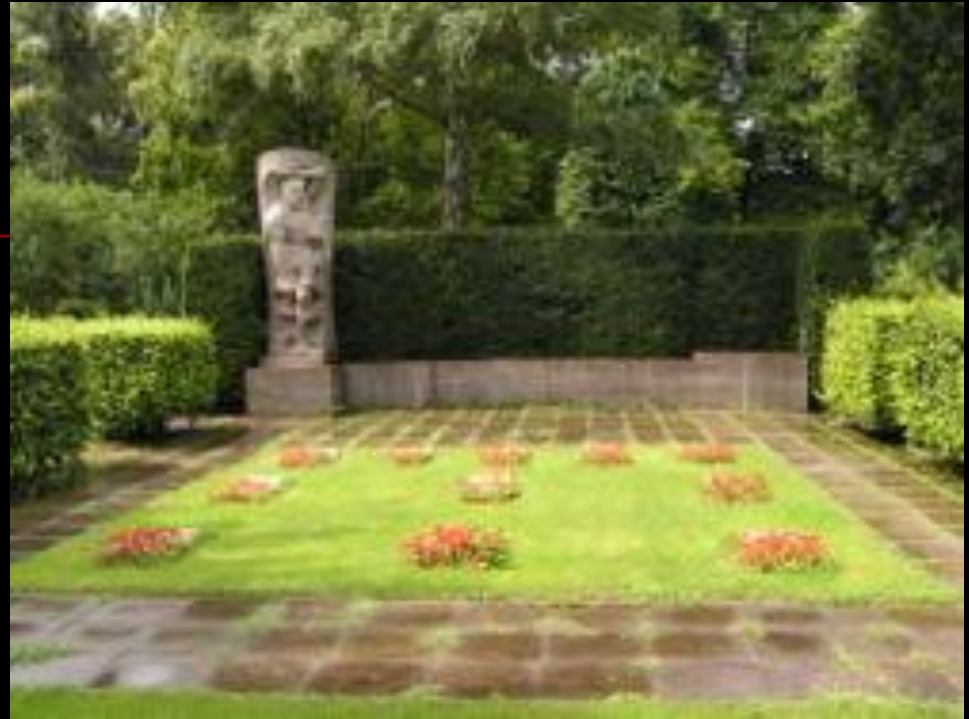
■ Братская могила и музей 11 погибших берлинцев на кладбище-колумбарии Зеештрассе

■ Берлинский кризис июня 1953 года (широко известно как «Берлинское восстание»; в Германии — как «Народное восстание 17 июня») — массовые антиправительственные народные выступления в ГДР 16—17 июня 1953 года. ■ Подавлено с помощью советских войск.