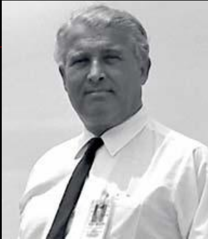
■ Вернер фон Браун