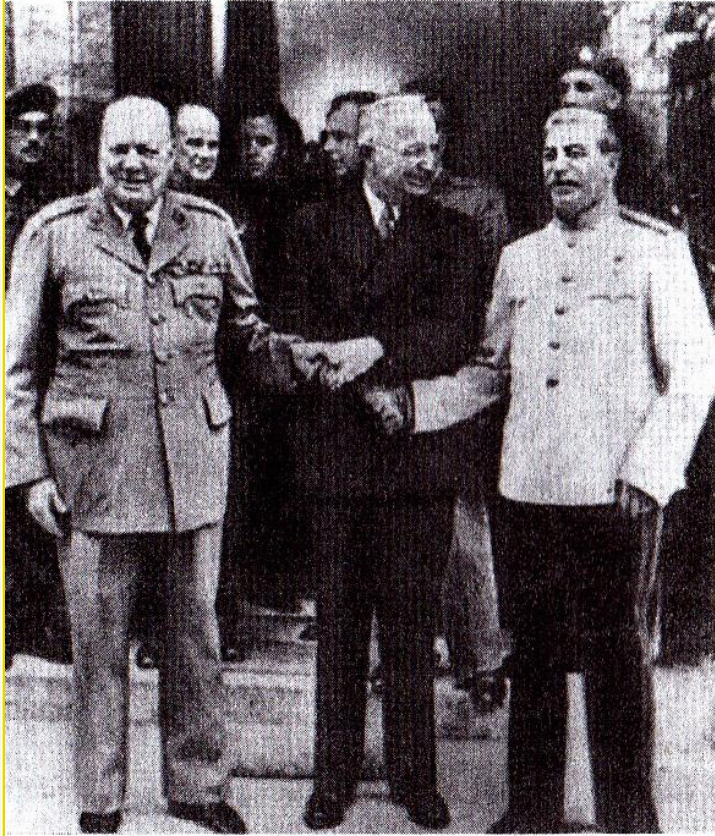
У. Черчилль, Г. Трумэн, И. Сталин.

Июль 1945 г. Г. Трумэн , президент США: «Русским нужно показать железный кулак и говорить сильным языком»;