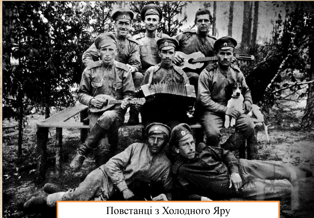
Повстанці з Холодного Яру

Після загибелі Василя Чучупаки 12 квітня 1920 р., Холодноярську республіку очолив його заступник Іван Деркач, він керував збройними силами регіону «Холодний Яр» під час антирадянського повстання у весняно-осінній період 1920 року. 8 вересня 1920 року — на з'їзді повстанських отаманів у Чигирині Деркач обраний членом Окружного повстанського комітету.