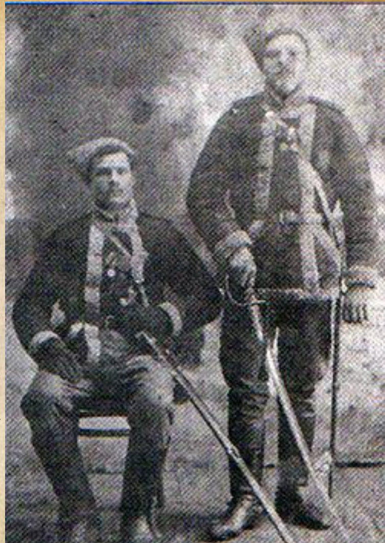
Козаки Холодного Яру з села Мельники з медалями Російської імперії на грудях.

У березні 1920 року Степова Дивізія армії УНР визволила Херсон від більшовиків та повела вдалий наступ на захід по лінії Кам'янка-Єградівка-Ружичів-Чигирин. Зупинилась дивізія в урочищі Холодний Яр, де з'єдналась з Холодноярськими збройними силами.