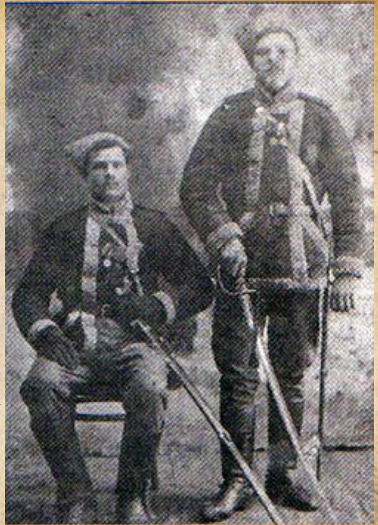
Козаки Холодного Яру з села Мельники з медалями Російської імперії на грудях.

У березні 1920 року Степова Дивізія армії УНР визволила Херсон від більшовиків та повела вдалий наступ на захід по лінії Кам'янка-Єградівка-Ружичів-Чигирин. Зупинилась дивізія в урочищі Холодний Яр, де з'єдналась з Холодноярськими збройними силами.