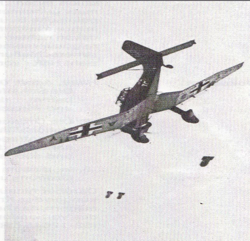
Angriff auf Polen