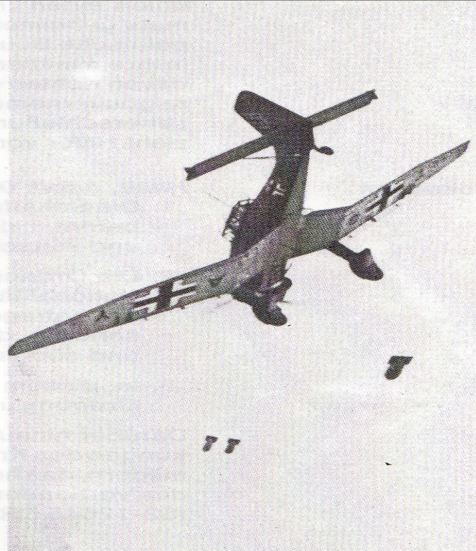
Angriff auf Polen