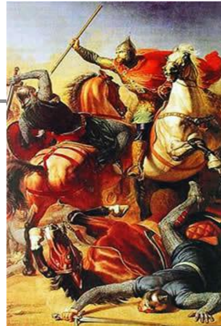
1240 г. – Невская битва (со шведами)