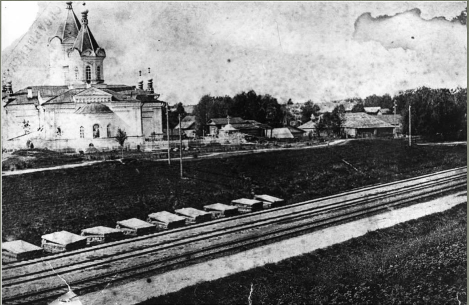
Церковь «Успения Божьей Матери», нач. 20 в.