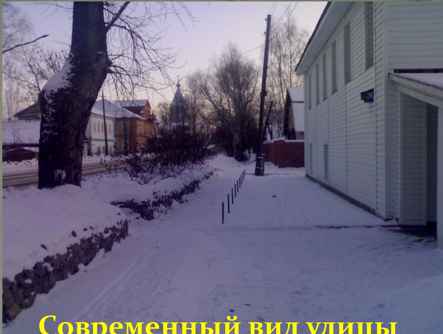
Современный вид улицы Гагарина