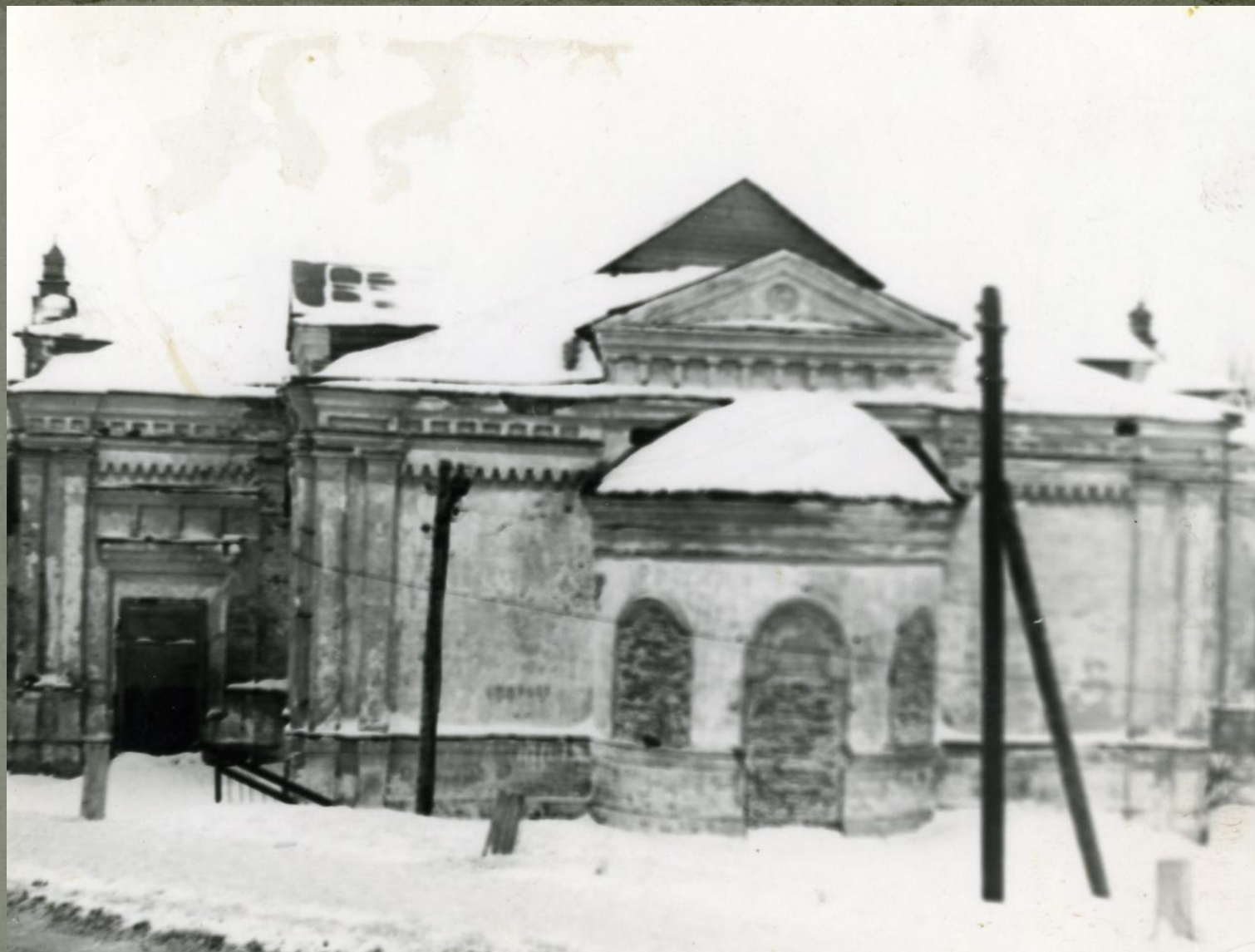
Храм Успения в 80-е годы.