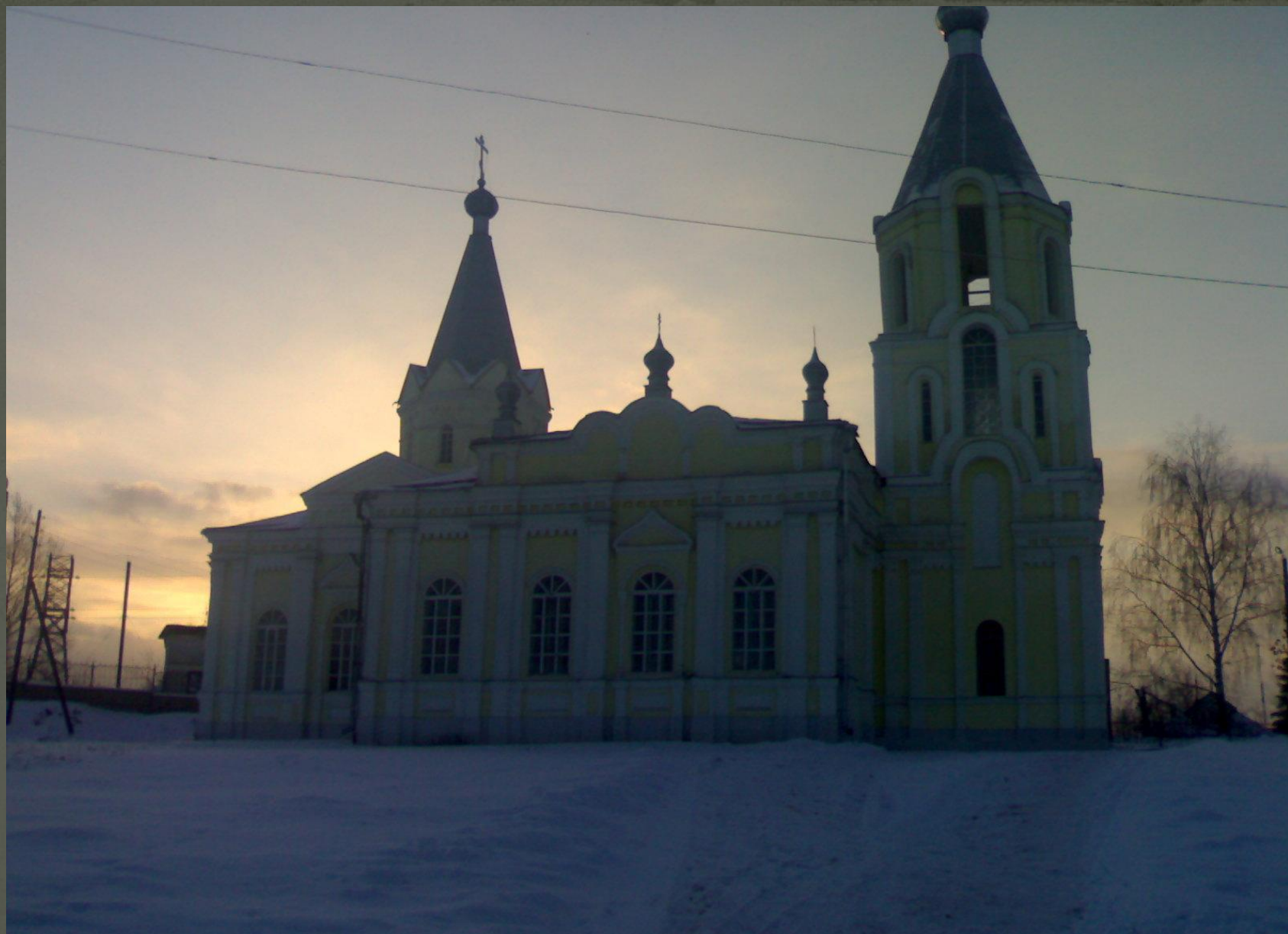
Храм «Успения Божьей Матери»