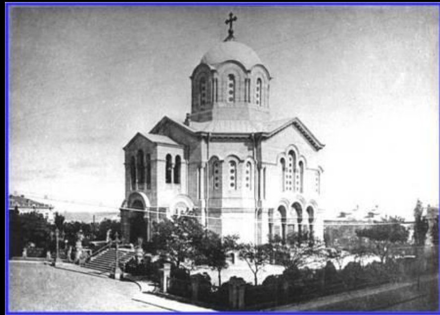
Владимирский собор (1854-1888 гг.) Архитектор К.А. Тон)