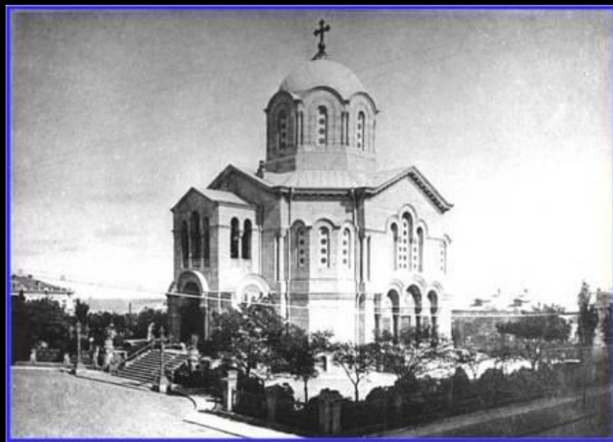
Владимирский собор (1854-1888 гг.) Архитектор К.А. Тон)