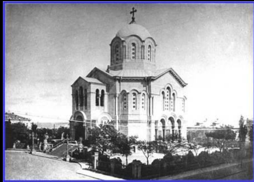
Владимирский собор (1854-1888 гг.) Архитектор К.А. Тон)