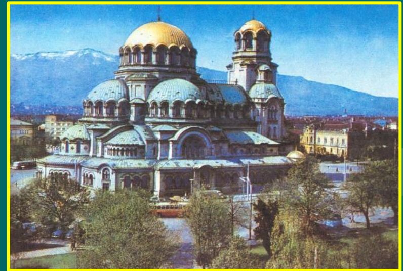
Собор св. Александра Невского в Софии (архитектор А.Померанцев)