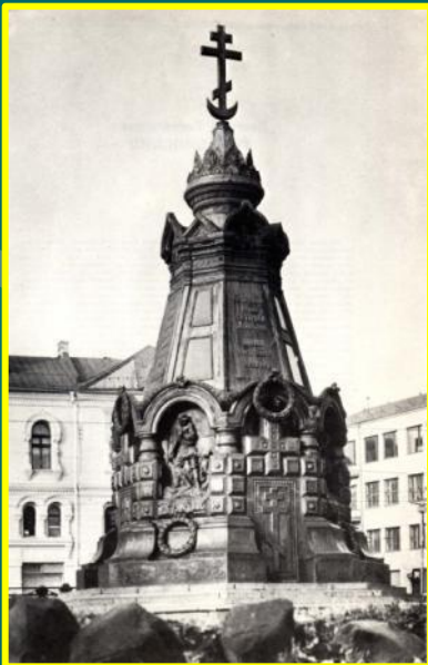
Часовня павшим в боях за Плевну (архитектор В.О. Шервуд), г.Москва