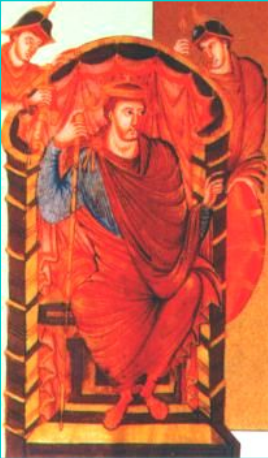
Карл Мартелл. Средневековая миниатюра

В 732 г. Мартелл разбил у г. Пуатье арабов завоевавших Испанию.