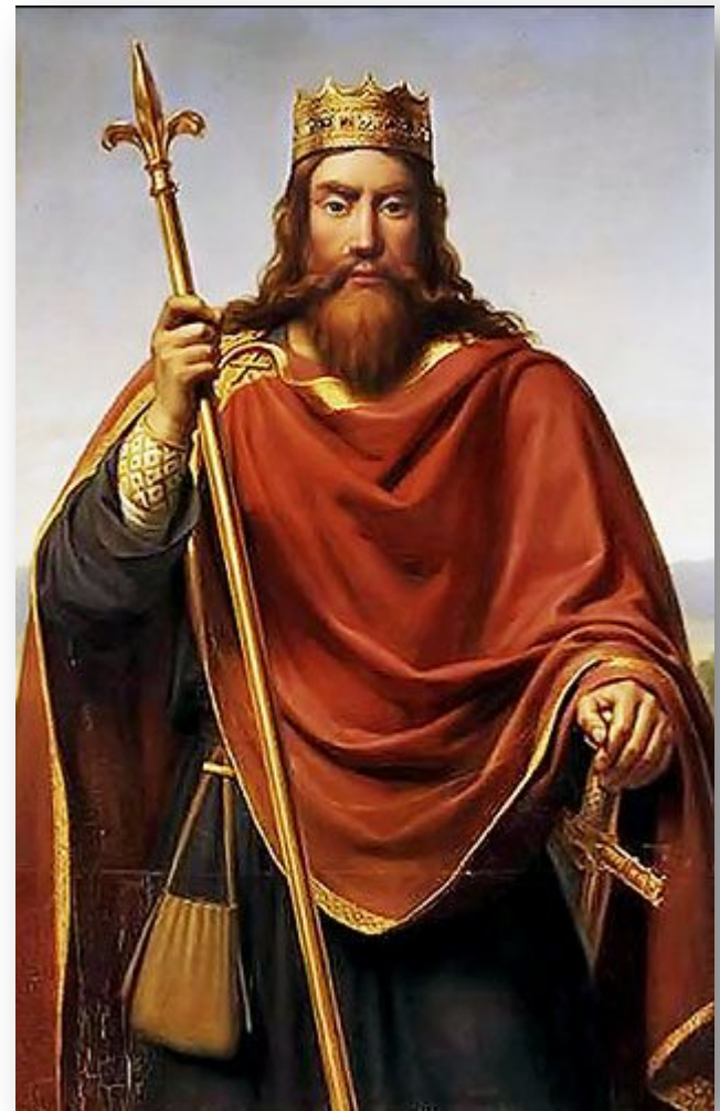
Византийский император Анастасий прислал Хлодвигу пурпурную мантию и диадему – знаки императорской власти