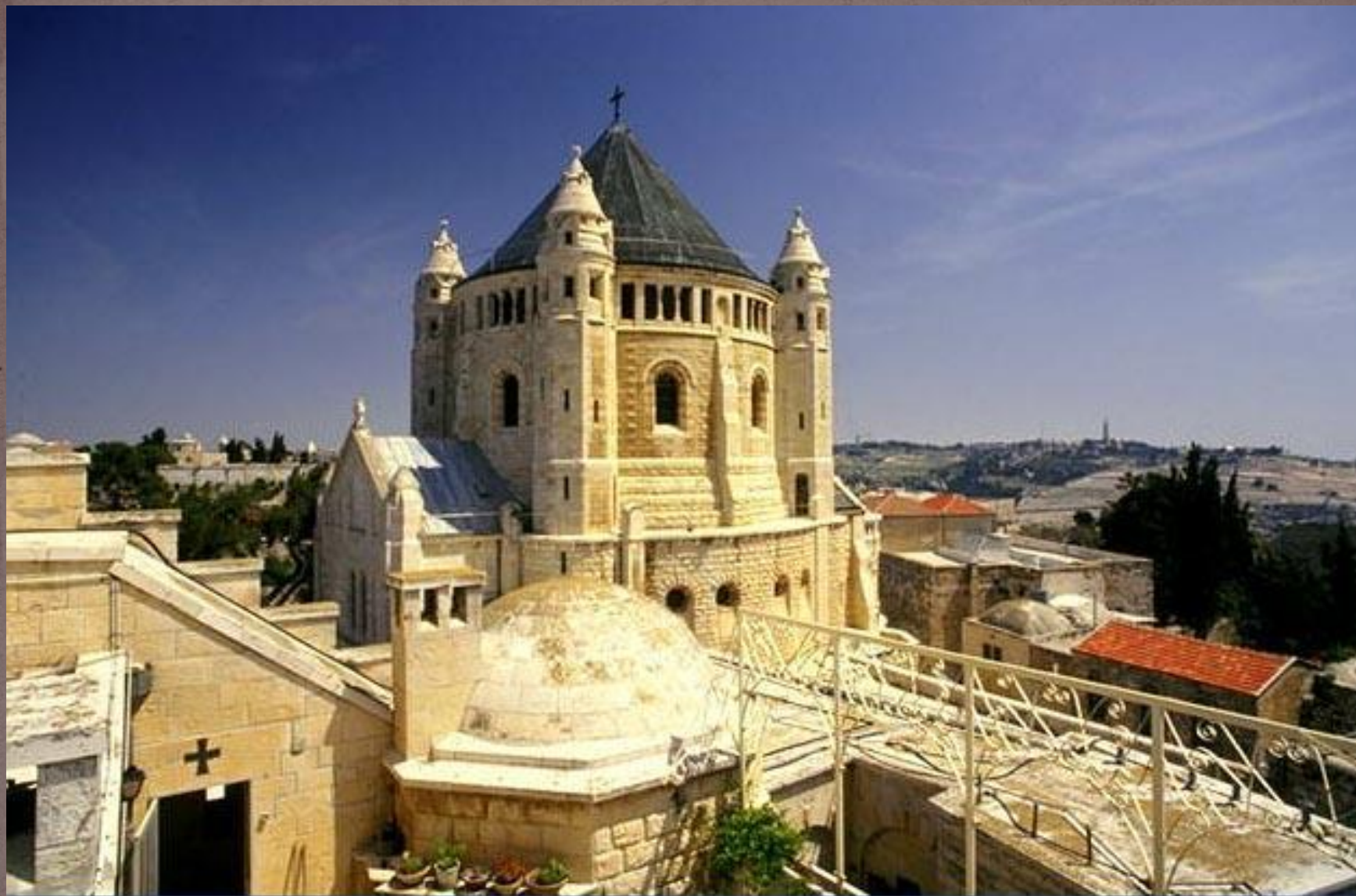
Старый Иерусалим. Успенский монастырь.