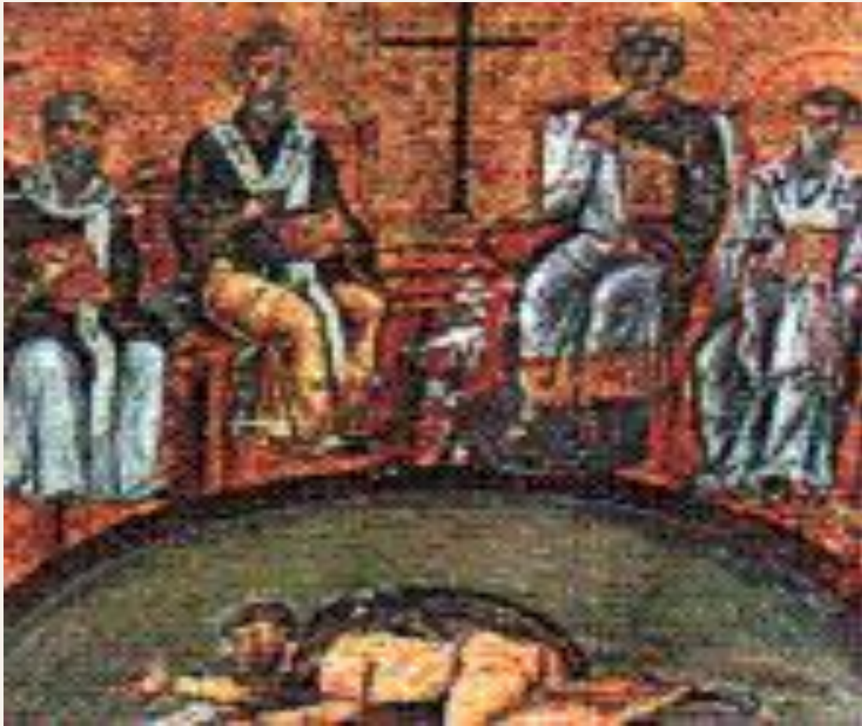
Никейский собор осуждает учение Ария — изображение IV века