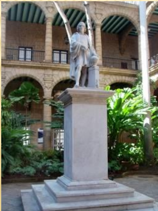
Памятники Х. Колумбу

Умер Колумб в испанском городе Вальядолиде 21 мая 1506 в присутствии брата Диего, сыновей Диего, Эрнандо и нескольких друзей по экспедиции. Его останки были перевезены в Севилью в 1513, а затем примерно в 1542, перезахоронены в соборе города Санто-Доминго (ныне Доминиканская Республика).