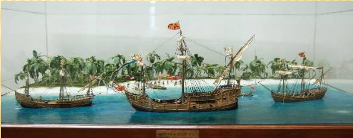
Модели «Санта – Марии», «Пинты» и «Ниньи».