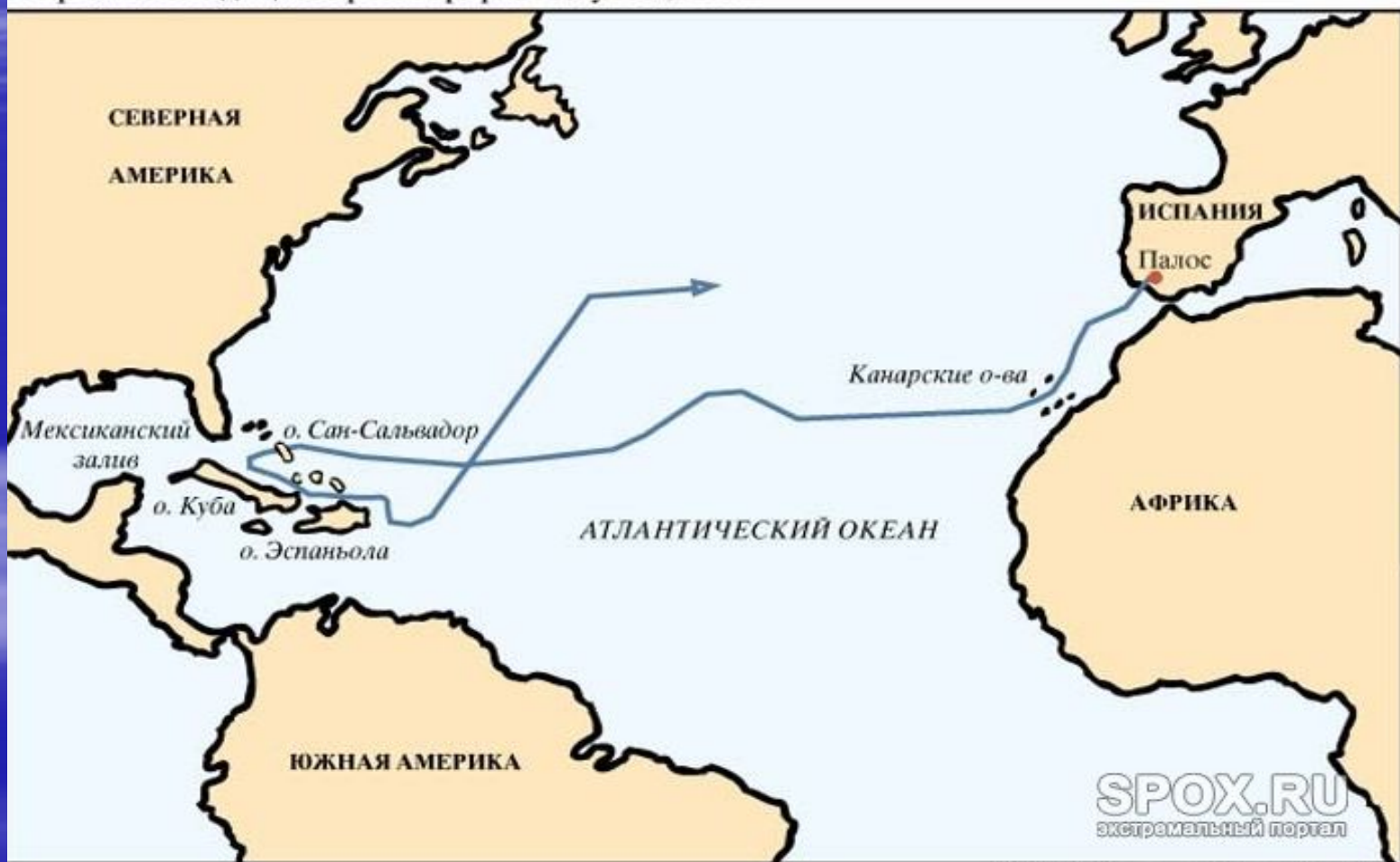
Первая экспедиция Христофора Колумба, 1492