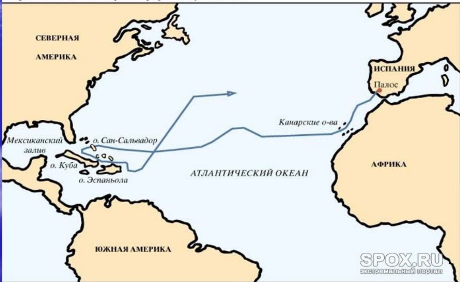
Первая экспедиция Христофора Колумба, 1492