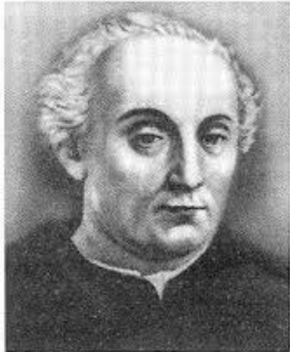
Христофор Колумб (1451–1506)

Учился в Павийском университете. Примерно в 1470 году женился на донье Фелипе Монис де Палестрелло, дочери мореплавателя времён принца Энрике. До 1472 года Колумб жил в Генуе, а с 1472 года — в Савоне. В 1470-е годы участвовал в морских торговых экспедициях.