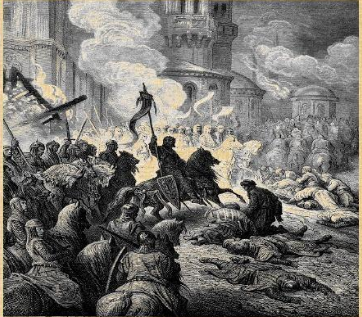
50. Entry of the Crusaders into Constantinople The Crusaders invade Constantinople, killing everyone they encounter, setting fire to the city, and trampling the Greeks into nothing.

Константинополь був узятий і жорстоко пограбований. Частина завойованих у Візантії територій відійшла до Венеції, на іншій частині була заснована так звана Латинська Імперія. У 1261 православні імператори з допомогою турків і суперниці Венеції - Генуї - знову зайняли Константинополь.