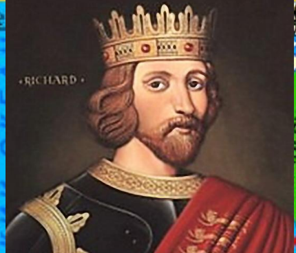
Річард I Левове Сердце (Англія)