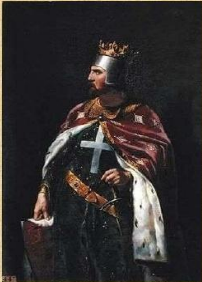
Річард Левове Серце

Похід розпочався після того як Єгипетський султан Салах-ад-дін (Саладін) завоював Єрусалим. Похід очолили німецький імператор Фрідріх I Барбаросса, французький король Філіп II і англійський король Річард I Левове Серце. 10 червня 1190 Літній Фрідріх Барбаросса упав з коня під час переправи через річку і захлинувся. Його смерть стала провісником (а можливо і причиною) майбутньої поразки. Перемоги Річарда Левове Серце підтримували існування хрестоносських держав у Палестині, але Єрусалим звільнити не вдалося.