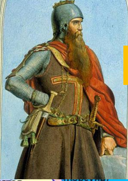
Фридрих I Барбаросса