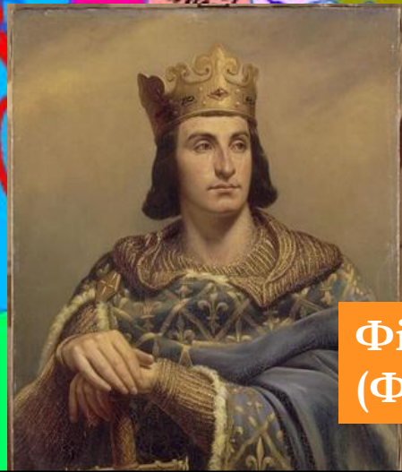
Філіп II (Франція)