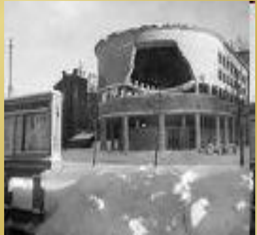
52-ая школа Кировского района