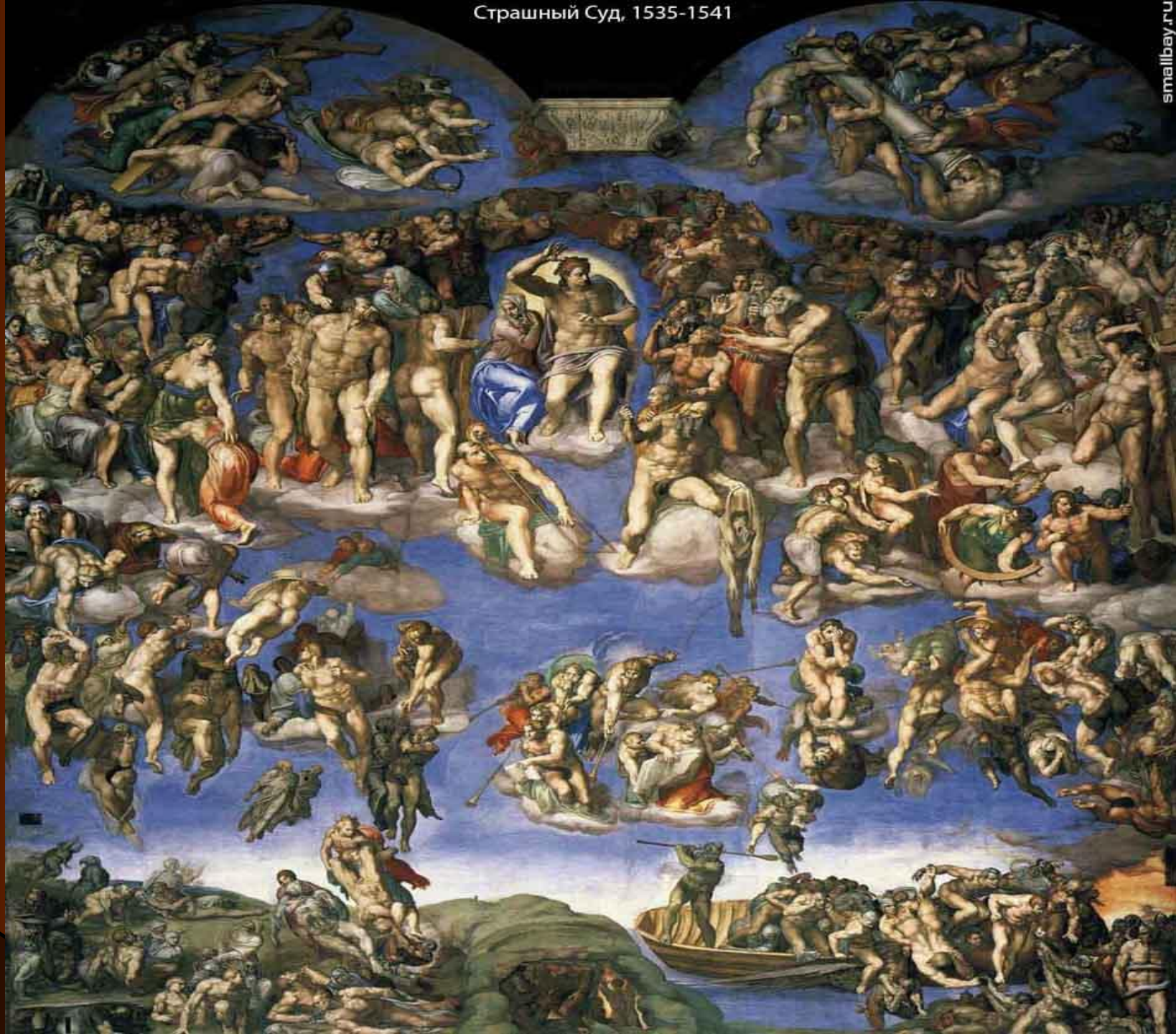
Страшный Суд, 1535-1541