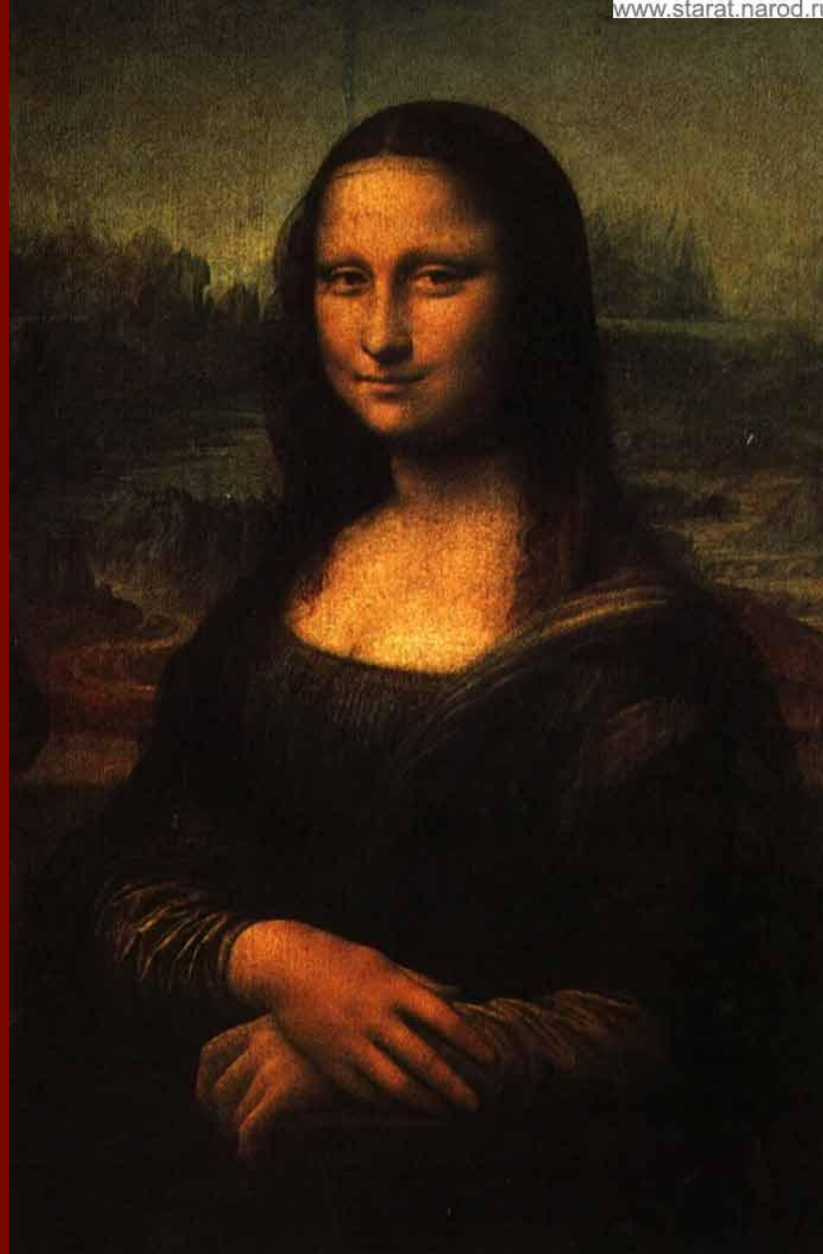
Мона Лиза (Джоконда)