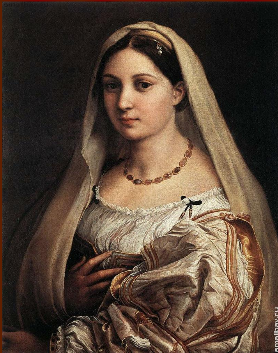
Дама в покрывале

1516 год. Галерея Палаццо Питти, Флоренция.