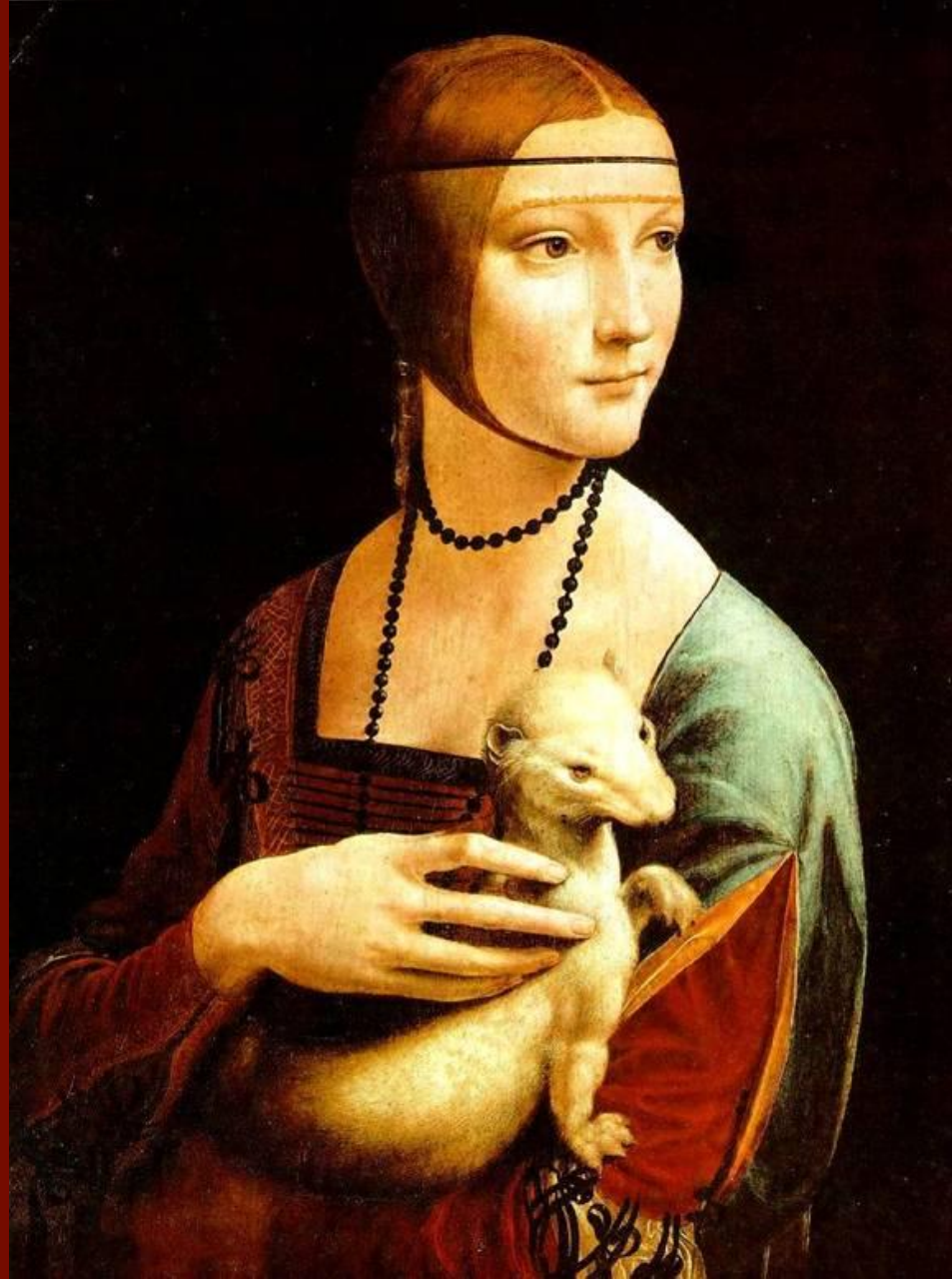
Дама с горностаем

1485-1490 годы. Национальный музей, Краков.