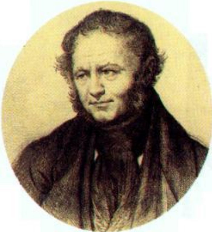
Стендаль. Гравюра н.19 в.

О. де Бальзак в цикле «Человеческая комедия» (ок. 100 произведений), нарисовал многогранную картину французского общества.