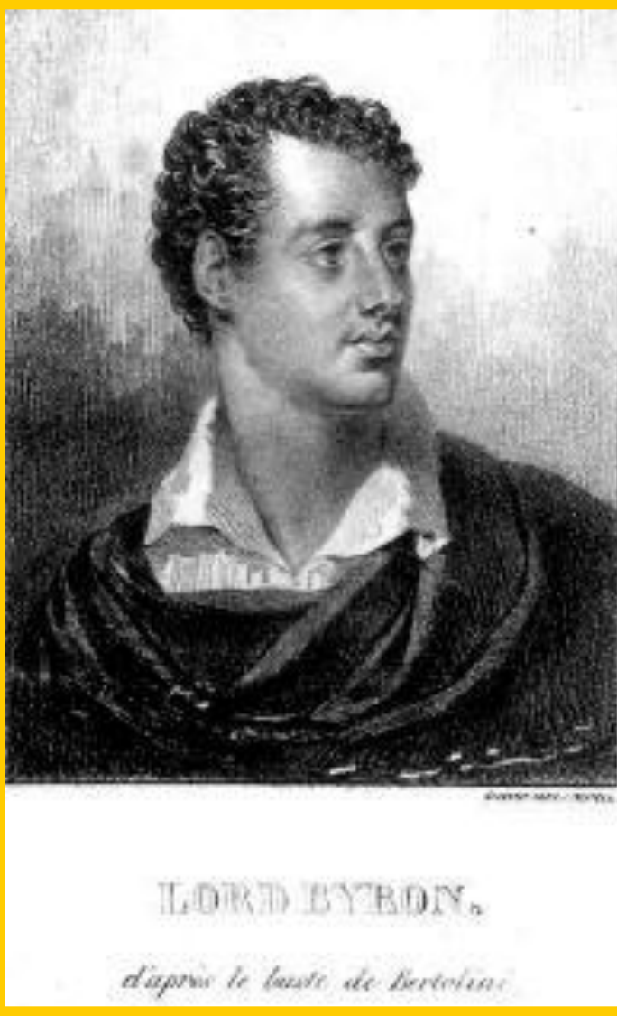
Джордж Байрон. Гравюра н.19 в.

Писатели 19 в. стремились глубоко исследовать действительность. На смену классицизму постепенно пришел романтизм. Это направление было обращено к прошлому, или к отвлеченным мечтаниям о добре и зле.