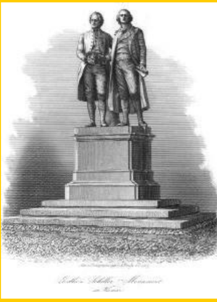
Гете и Шиллер. Гравюра н.19 в.

Байрон отправился в Грецию, чтобы принять участие в начавшейся там революции, но заболел и умер.