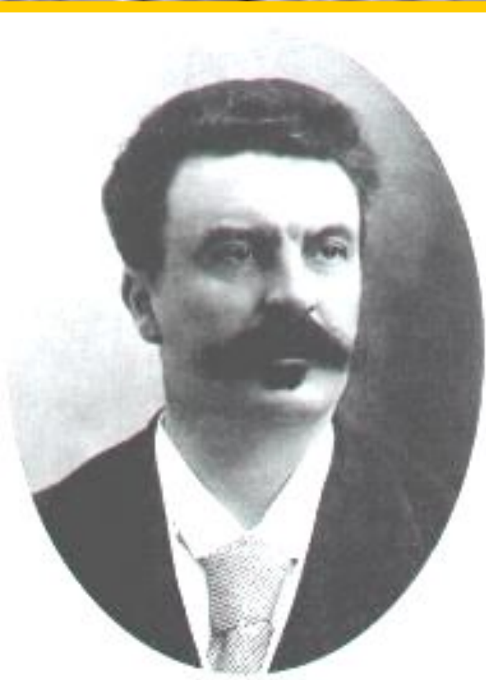
Ги де Мопассан.

В к.19 в. появился натурализм-течение отображавшее жизнь без прикрас. Авторы работавшие в данном ключе подвергались жесточайшей критике. Особенно доставалось Э.Золя и Г.де Мопассану. Но в их произведениях натурализм был лишь фоном для вскрытия острейших социальных проблем.