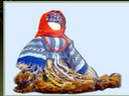
Тряпичная кукла «без лица»