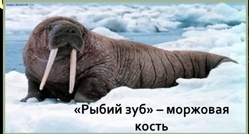
«Рыбий зуб» – моржовая кость