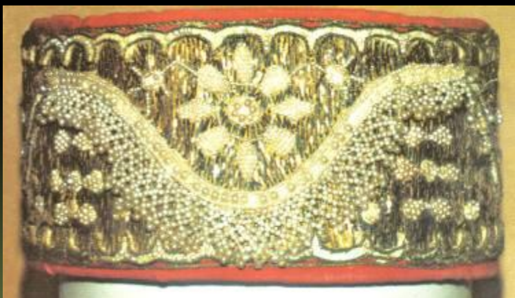
Вышивка золотыми нитями