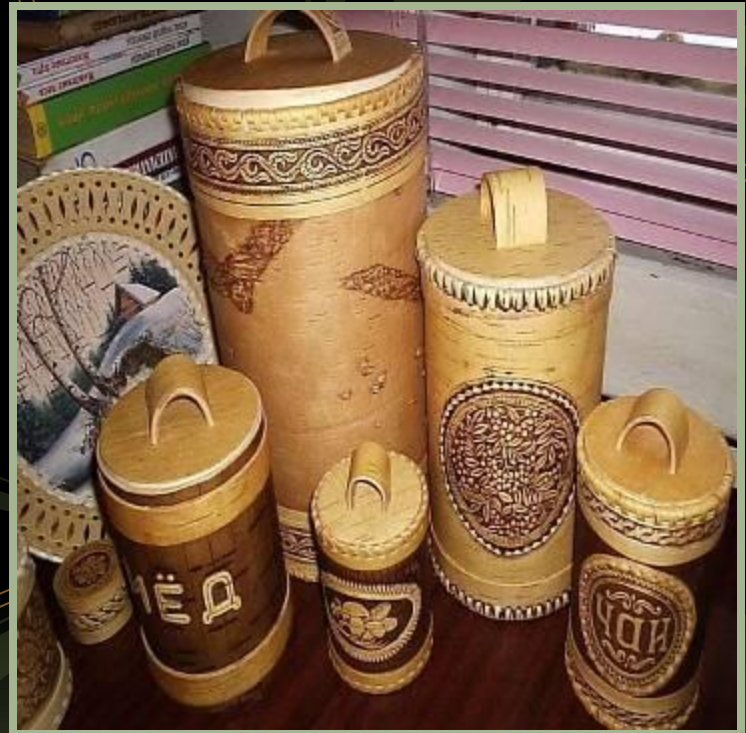
Береста и быт

Как правило, мастера заполняли поверхность изделий растительным орнаментом. Сквозное, ажурное «кружево» (резьбу) из бересты мастера накладывали обычно на яркий фон из ткани, фольги или бумаги.