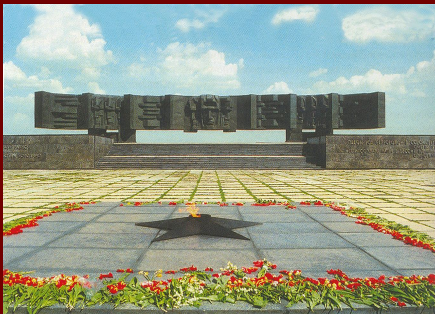
Мемориальный комплекс «В честь героев Курской битвы» (624 км автомагистрали Москва—Симферополь)