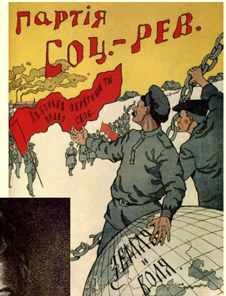
Агитационный плакат партии

Социализация земли означала, во-первых, отмену частной собственности на землю, вместе с тем не превращение её в государственную собственность, не её национализацию, а превращение в общенародное достояние без права купли-продажи. Во-вторых, переход всей земли в заведование центральных и местных органов народного самоуправления, начиная от демократически организованных сельских и городских общин и кончая областными и центральными учреждениями. В-третьих, пользование землёй должно было быть уравнильно-трудовым, то есть обеспечивать потребительную норму на основании приложения собственного труда, единоличного или в товариществе.