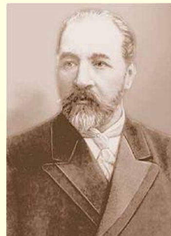
Дубровин А.Н. «Союз русского народа»