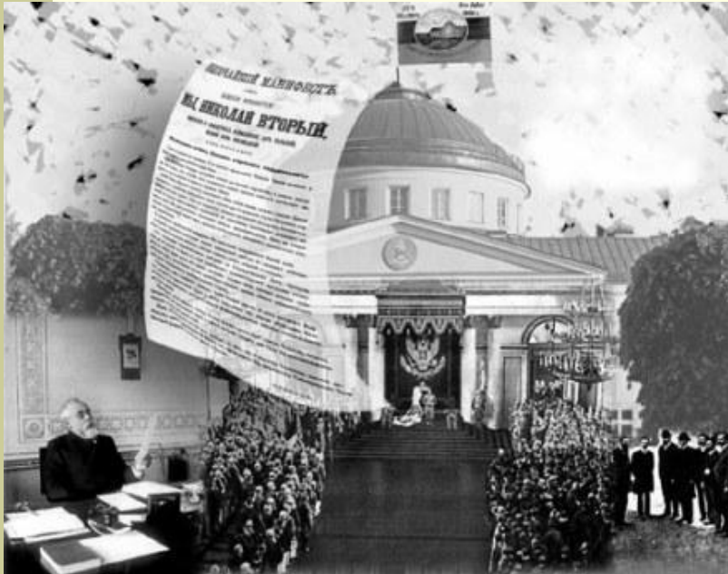
Таврический дворец Архитектор Старов