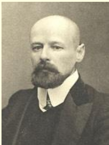
Пуришкевич В.М «Русский народный союз имени Михаила Архангела»