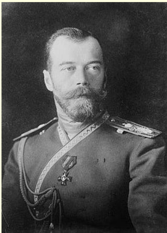
НИКОЛАЙ II АЛЕКСАНДРОВИЧ