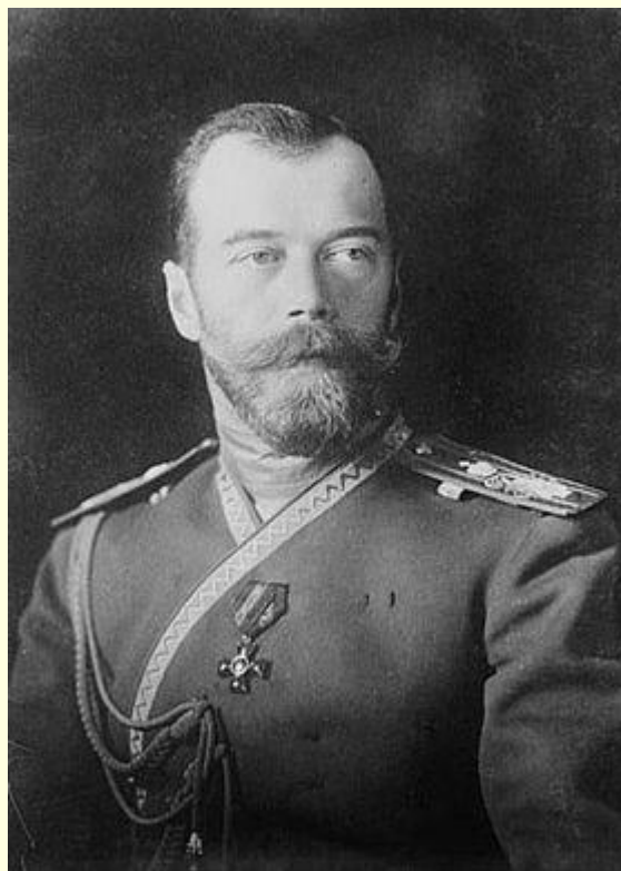
НИКОЛАЙ II АЛЕКСАНДРОВИЧ