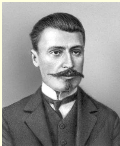
Ираклий Георгиевич Церетели

Алексинский Григорий Алексеевич представитель группы депутатов Государственной думы второго созыва, публицист, социал-демократ.