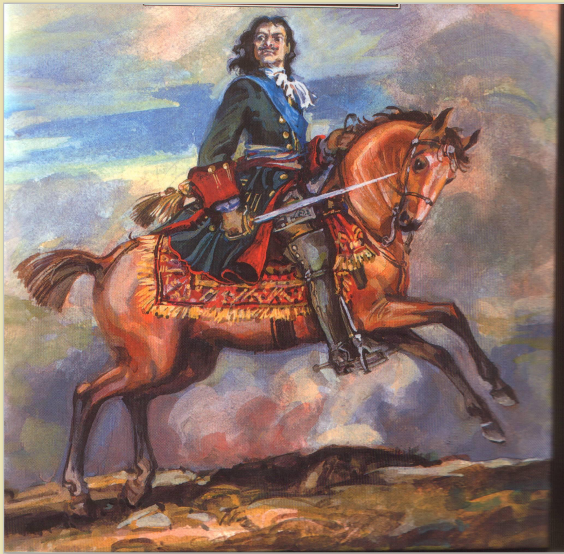
Иллюстрация к поэме А.С. Пушкина «Полтава». Художник Ю. Иванов