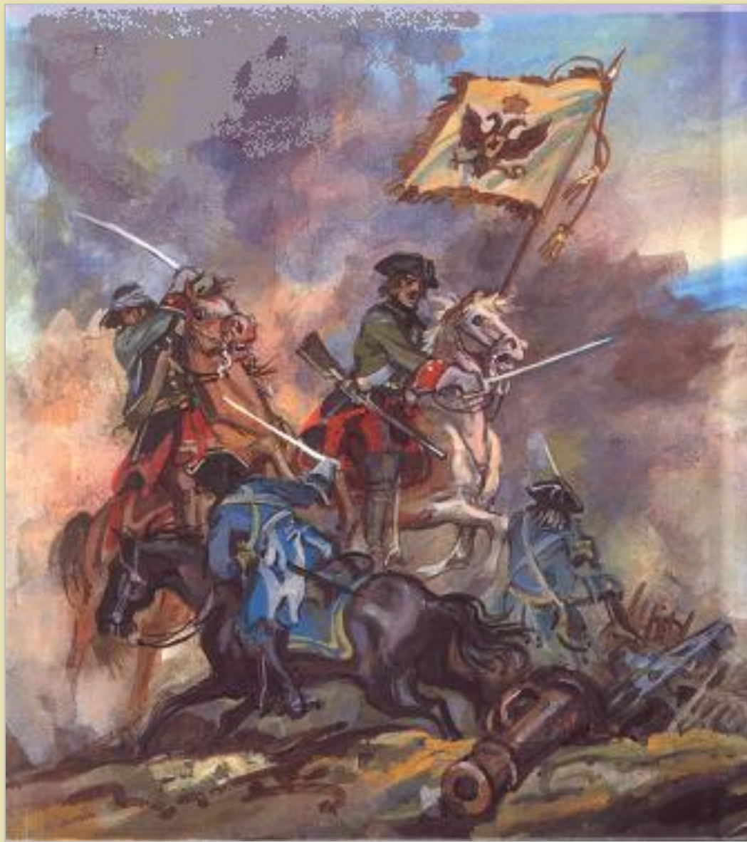
Иллюстрация к поэме А.С. Пушкина «Полтава». Художник Ю. Иванов