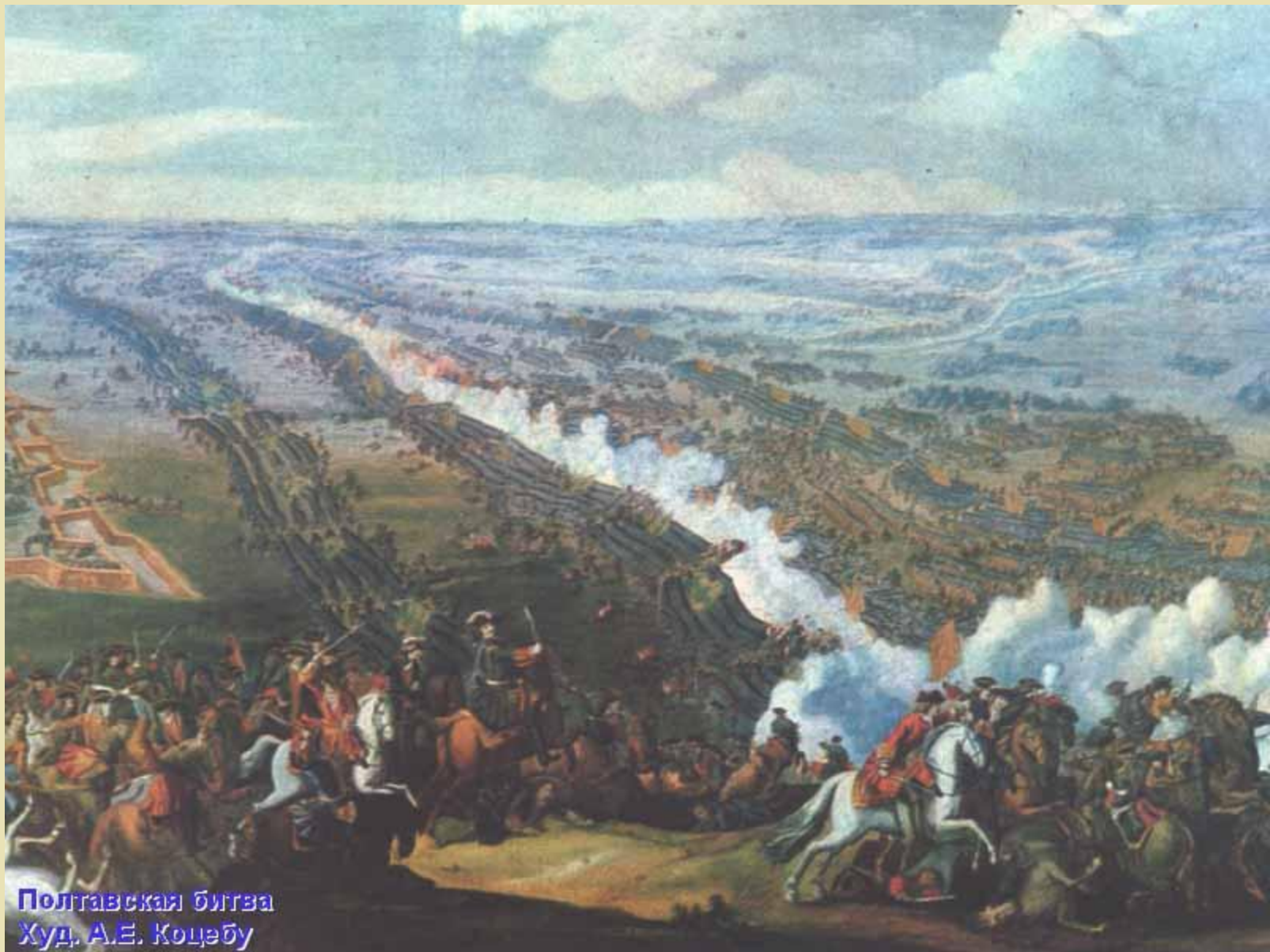
Полтавская битва Худ. А.Е. Коцебу