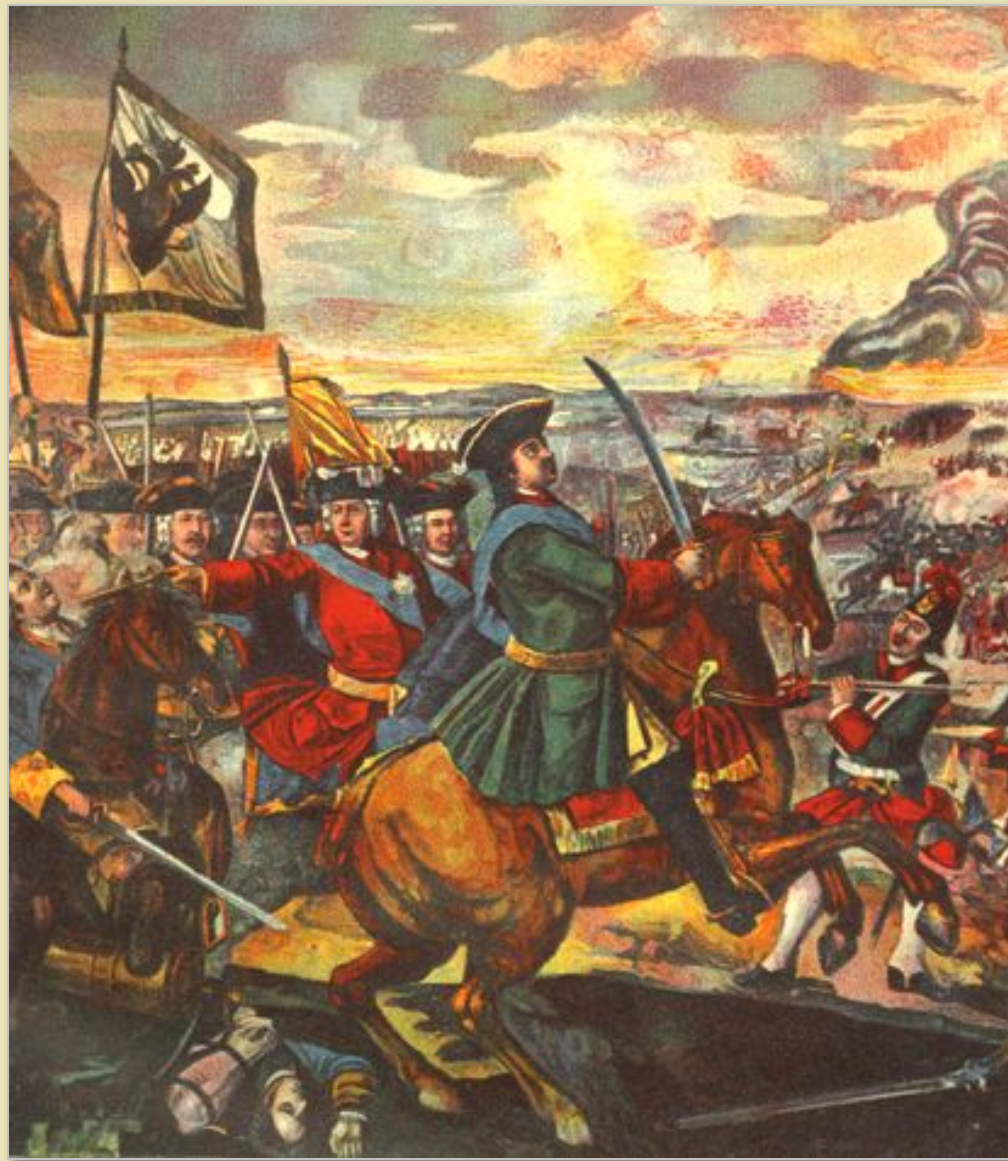
Мозаика М.В. Ломоносова «Полтавская баталия». XVIII в.