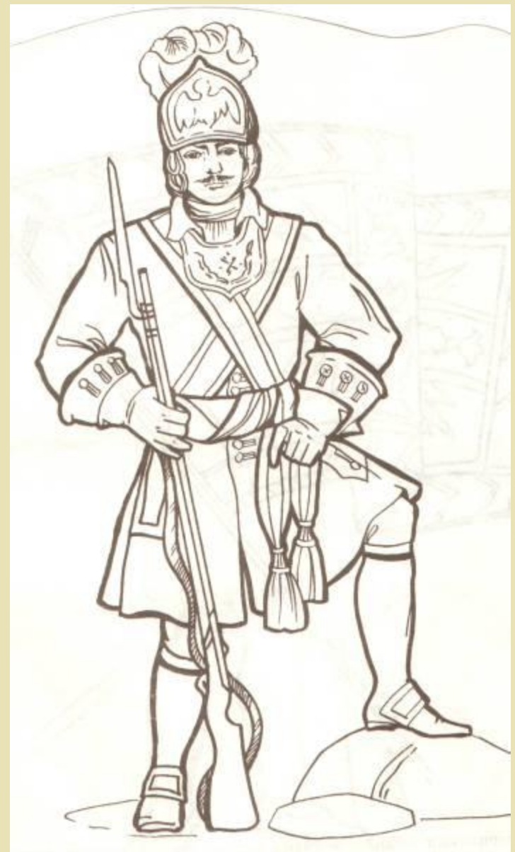
Офицер гренадёрской роты Преображенского полка в зелёном кафтани с красными обшлагами.