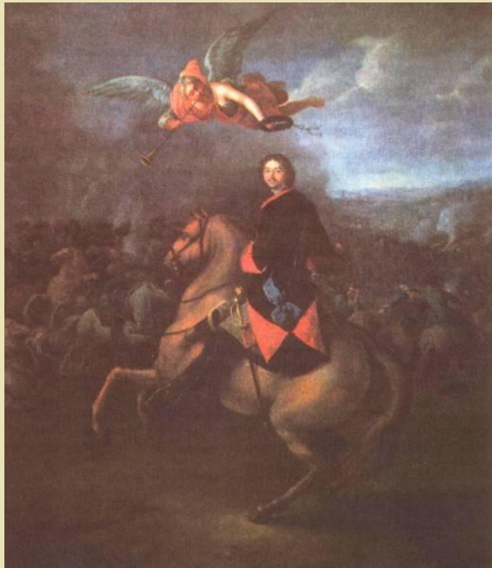
Пётр Великий в Полтавской битве. Художник И.Г. Тоннауер