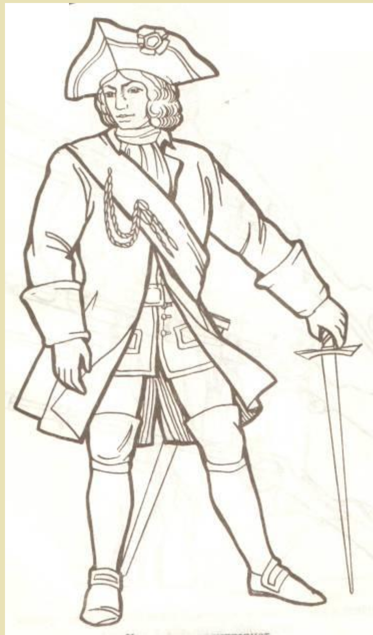
Канонир - артиллерист