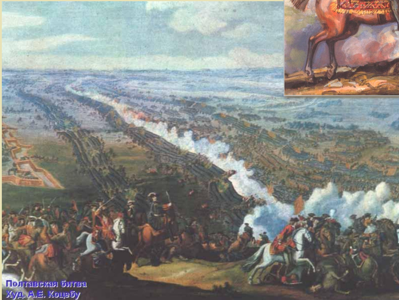
Полтавская битва Худ. А.Е. Коцебу