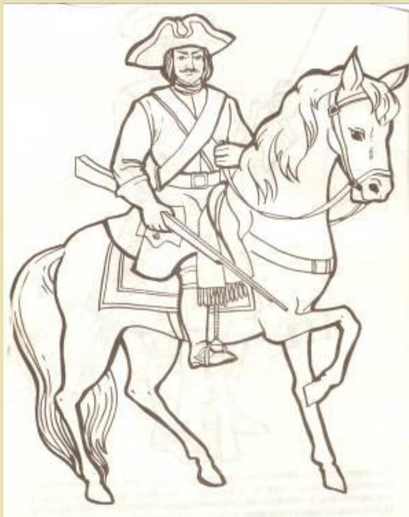
Кавалергард – конный гвардеец.