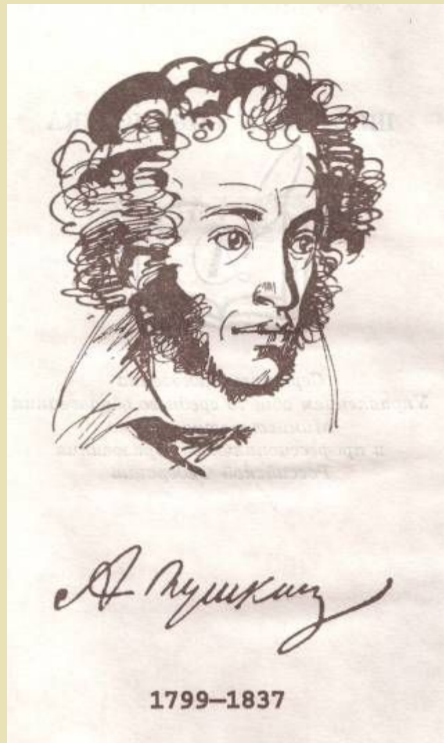
Иллюстрации к поэме А.С. Пушкина «Полтава». Художник Ю. Иванов