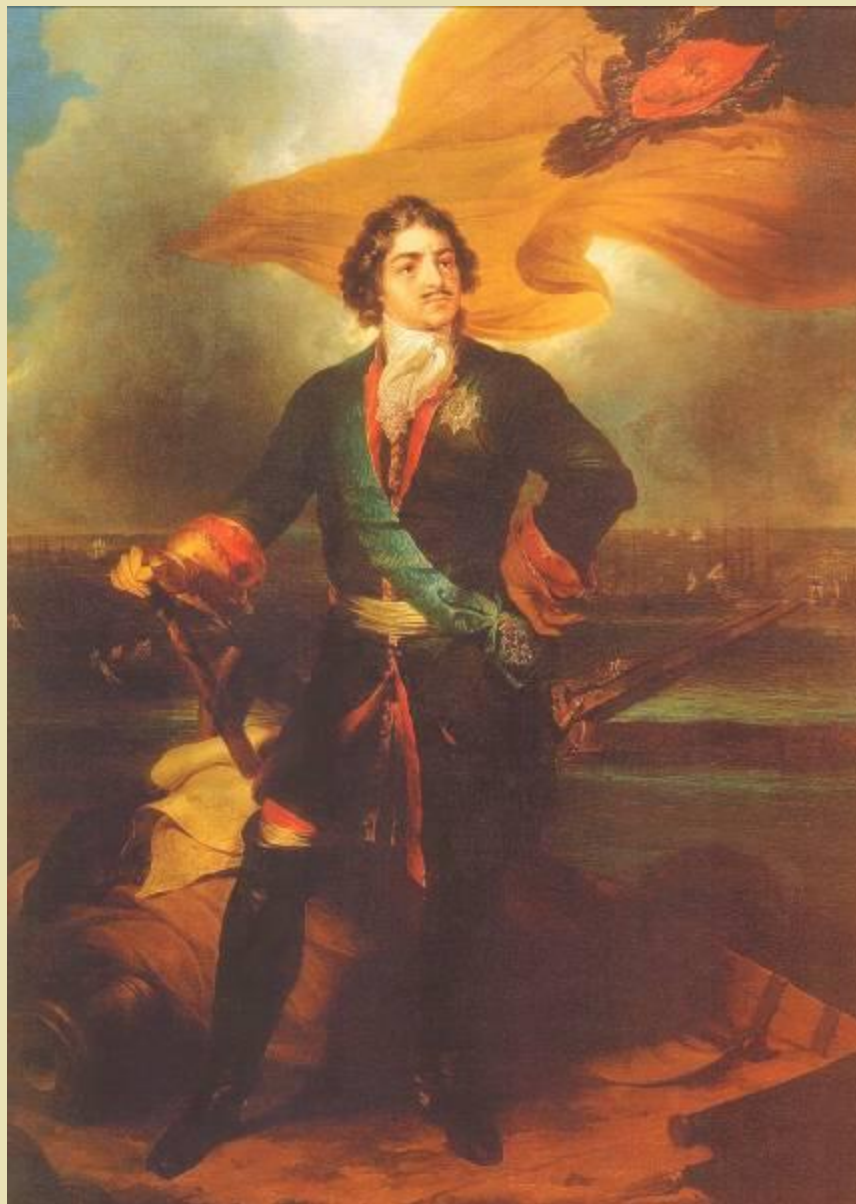
Император Пётр I. XVIII в. Неизвестный художник.