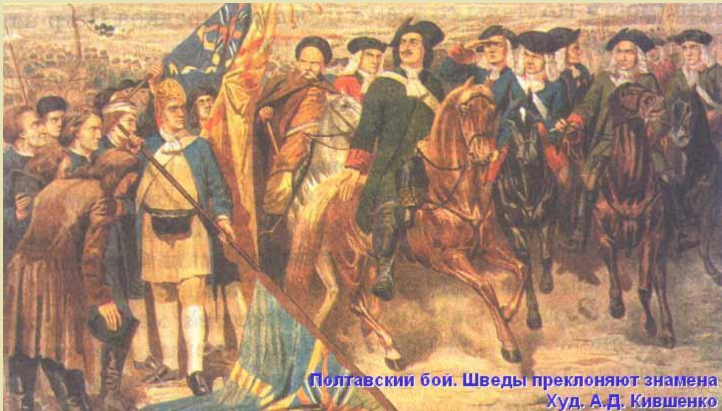
Полтавский бой. Шведы преклоняют знамена Худ. А.Д. Кившенко