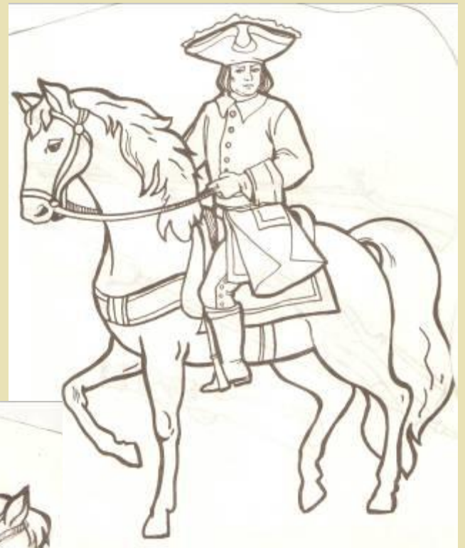
Русский драгун на вооружении имел пистолеты и ружьё, притороченное к седлу.