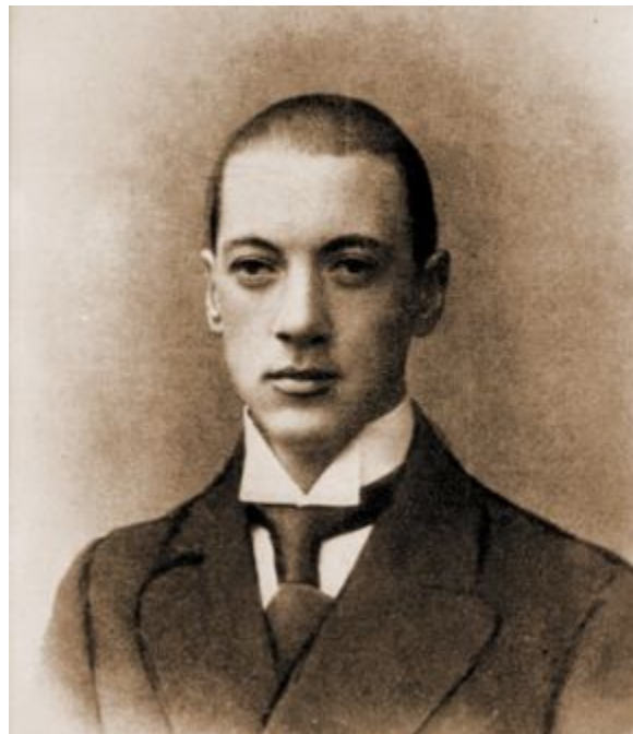
Н. С. Гумилев