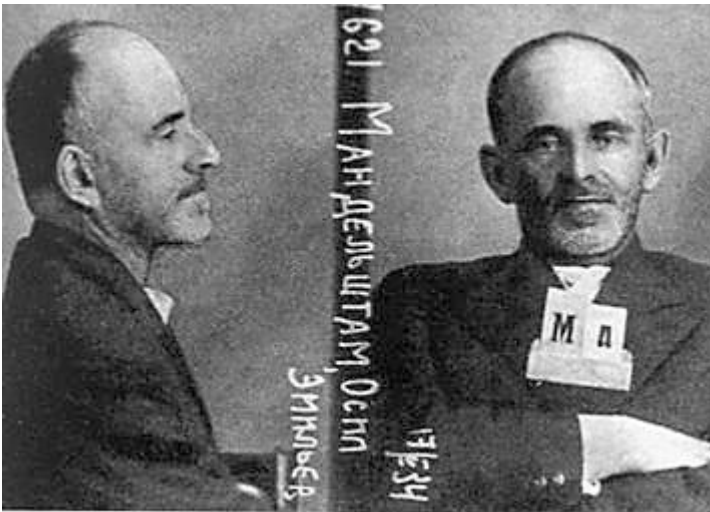
О. Э. Мандельштам

Тоталитарный строй уничтожал свободу творчества, духовного поиска, художественного самовыражения — последовательно и методично.