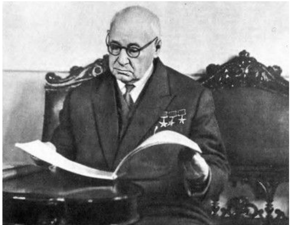
А. Н. Туполев