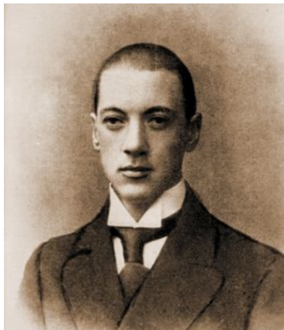
Н. С. Гумилев