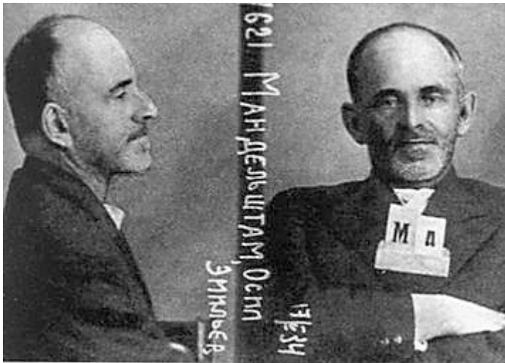
О. Э. Мандельштам

Тоталитарный строй уничтожал свободу творчества, духовного поиска, художественного самовыражения — последовательно и методично.