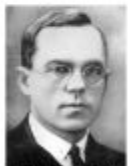
Н. Д. Кондратьев

Н. Д. Кондратьев, А. В. Чаянов, философ П. А. Флоренский и др.