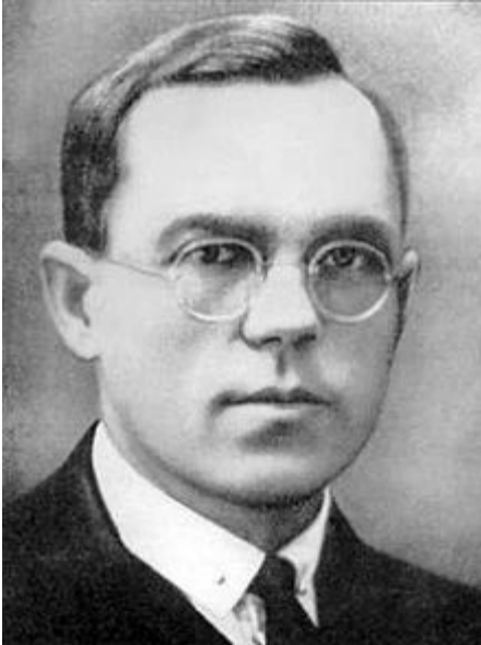
Н. Д. Кондратьев

Н. Д. Кондратьев А. В. Чаянов, философ П. А. Флоренский и др.