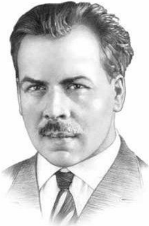
Н. И. Вавилов,

Был арестован и замучен в лагерях выдающийся генетик Н. И. Вавилов, в «шарашках» (конструкторских бюро и лабораториях, созданных в местах заключения) трудились: А. Н. Туполев, С. П. Королев, В. П. Глушко и др.