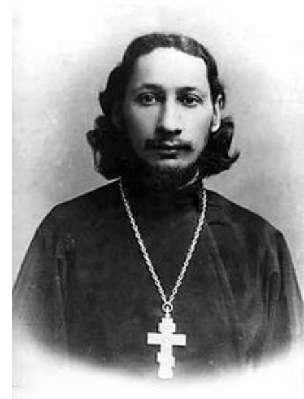
П. А. Флоренский