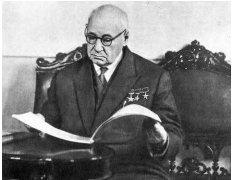
А. Н. Туполев