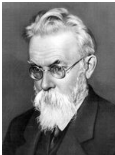
В. И. Вернадский

В. И. Вернадским, А. Ф. Иоффе, П. Л. Капицей, Н. И. Вавиловым, С. В. Лебедевым, Н. Д. Зелинским, А. Н. Туполевым, И. В. Курчатовым и др.