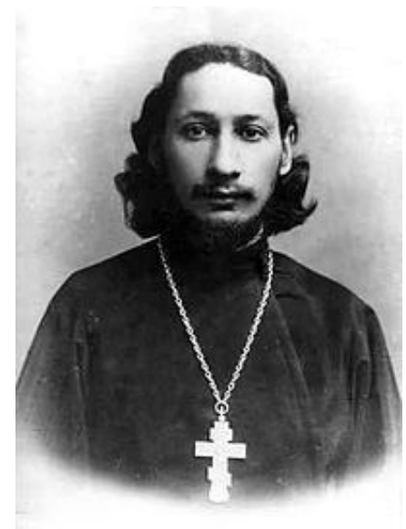
П. А. Флоренский