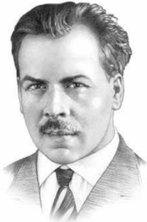
Н. И. Вавилов,

Был арестован и замучен в лагерях выдающийся генетик Н. И. Вавилов, в «шарашках» (конструкторских бюро и лабораториях, созданных в местах заключения) трудились: А. Н. Туполев, С. П. Королев, В. П. Глушко и др.