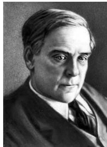
П. Л. Капица