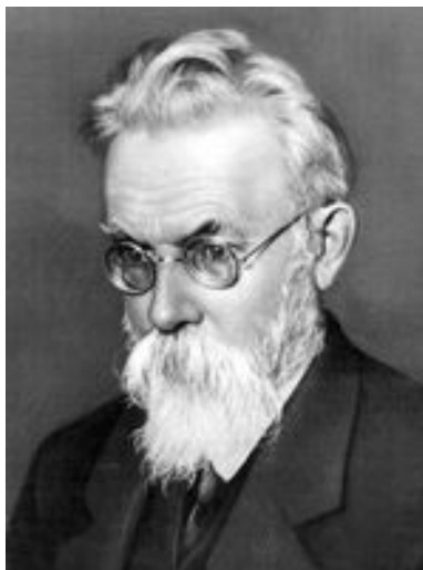
В. И. Вернадский

В. И. Вернадским, А. Ф. Иоффе, П. Л. Капицей, Н. И. Вавиловым, С. В. Лебедевым, Н. Д. Зелинским, А. Н. Туполевым, И. В. Курчатовым и др.