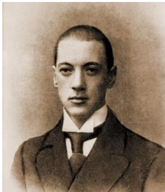
Н. С. Гумилев