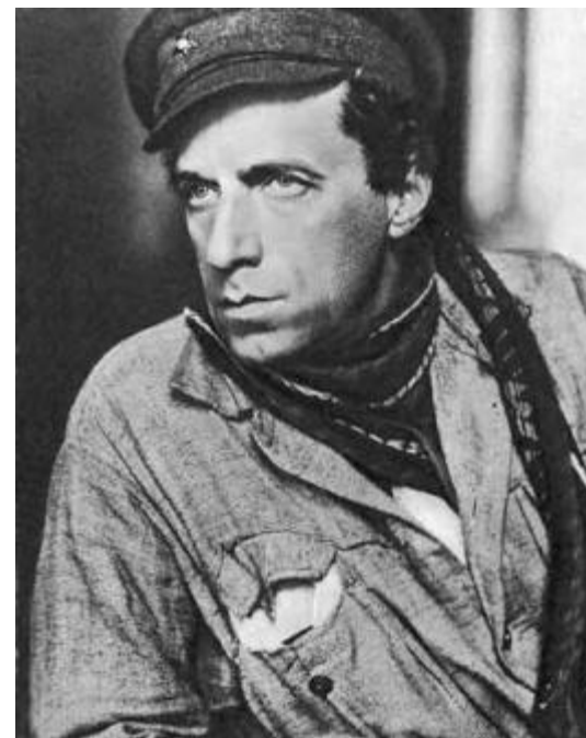
В. Э. Мейерхольд