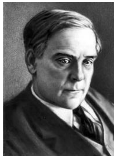
П. Л. Капица