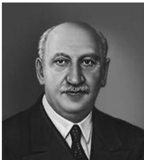
А. Ф. Иоффе