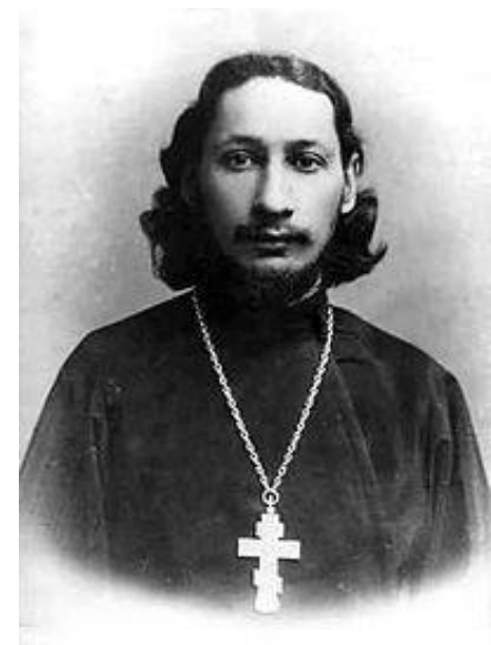
П. А. Флоренский