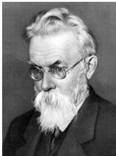
В. И. Вернадский

В. И. Вернадским, А. Ф. Иоффе, П. Л. Капицей, Н. И. Вавиловым, С. В. Лебедевым, Н. Д. Зелинским, А. Н. Туполевым, И. В. Курчатовым и др.