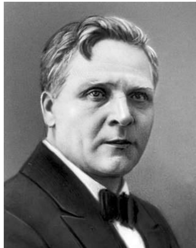
Ф. И. Шаляпин