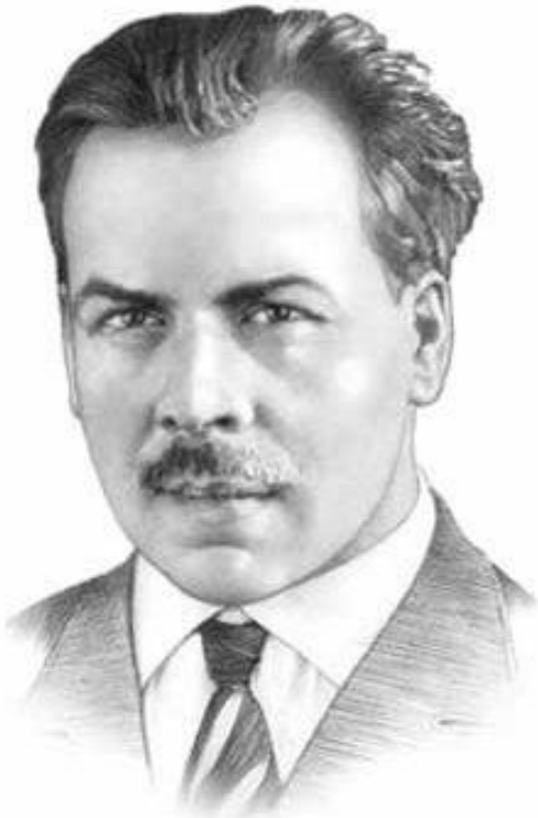
Н. И. Вавилов,

Был арестован и замучен в лагерях выдающийся генетик Н. И. Вавилов, в «шарашках» (конструкторских бюро и лабораториях, созданных в местах заключения) трудились: А. Н. Туполев, С. П. Королев, В. П. Глушко и др.