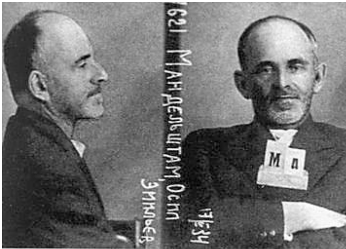
О. Э. Мандельштам

Тоталитарный строй уничтожал свободу творчества, духовного поиска, художественного самовыражения — последовательно и методично.