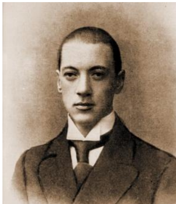
Н. С. Гумилев