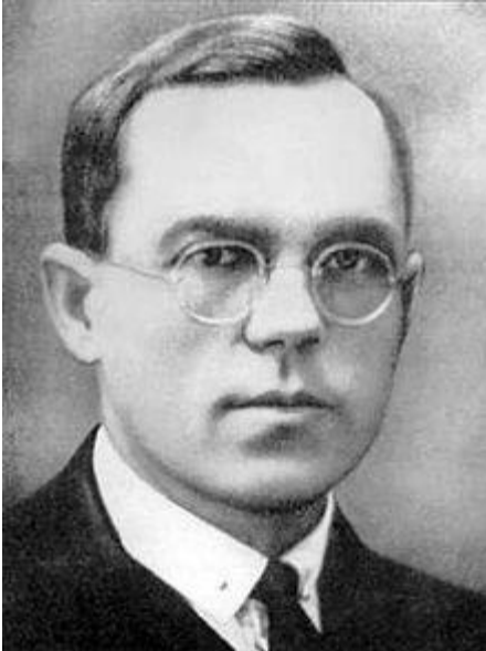
Н. Д. Кондратьев

Н. Д. Кондратьев А. В. Чаянов, философ П. А. Флоренский и др.