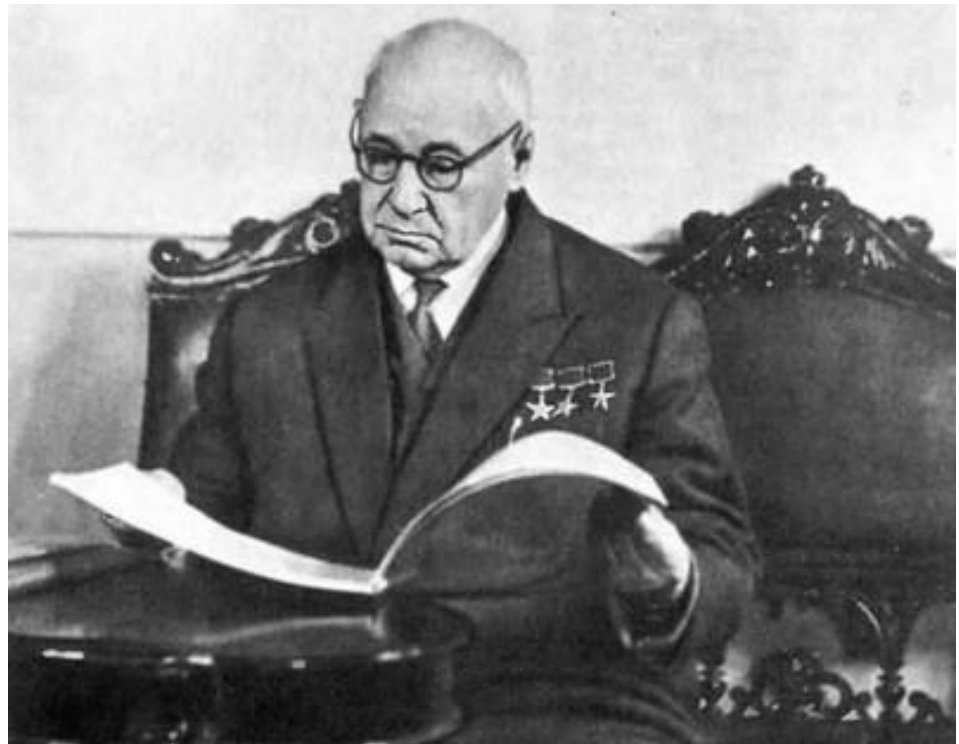
А. Н. Туполев