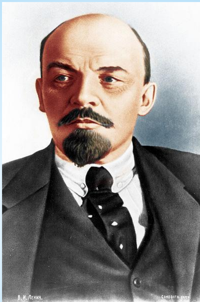
Ленин (Ульянов) Владимир Ильич (1870-1924гг)