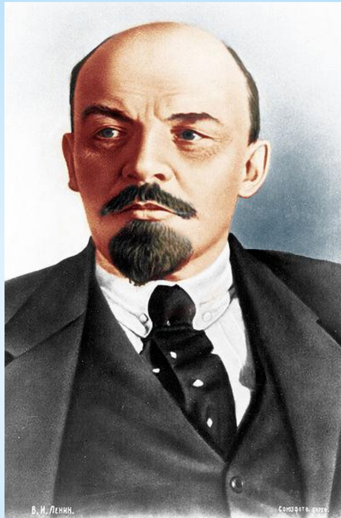
Ленин (Ульянов) Владимир Ильич (1870-1924гг)