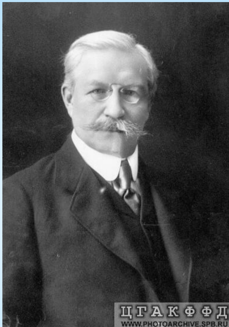
Милюков Павел Николаевич (1859-1943 гг)