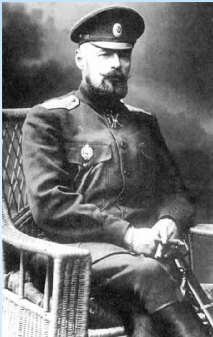
Пуришкевич Владимир Митрофанович (1870-1920гг)