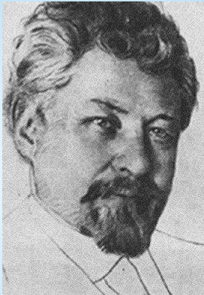
Чернов Виктор Михайлович (1873-1952 гг)