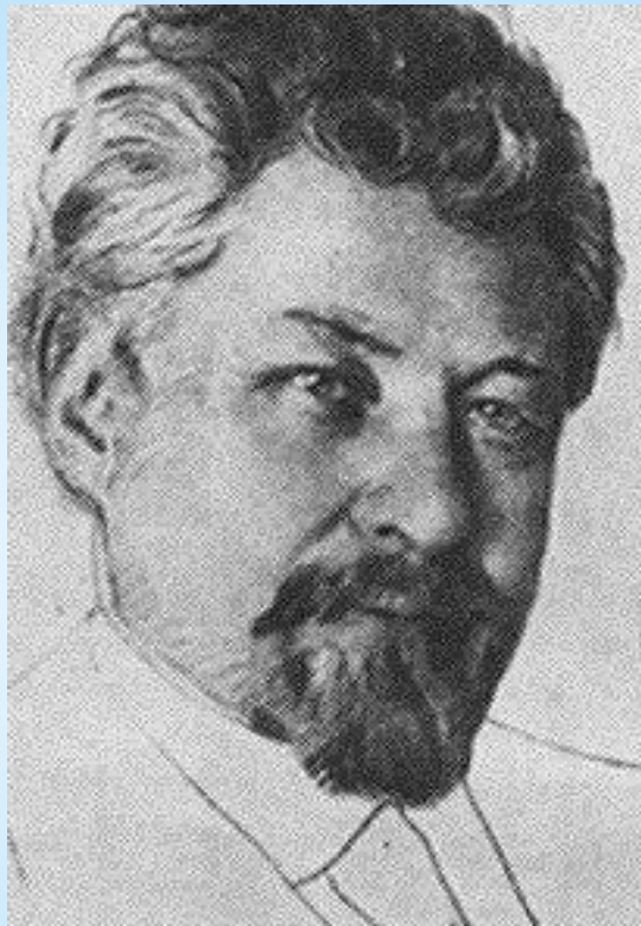
Чернов Виктор Михайлович (1873-1952 гг)