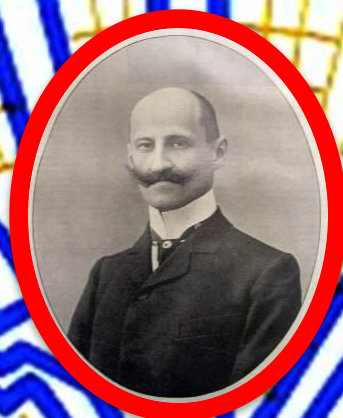
Председатель Государственной думы кадет Ф.А. Головин.