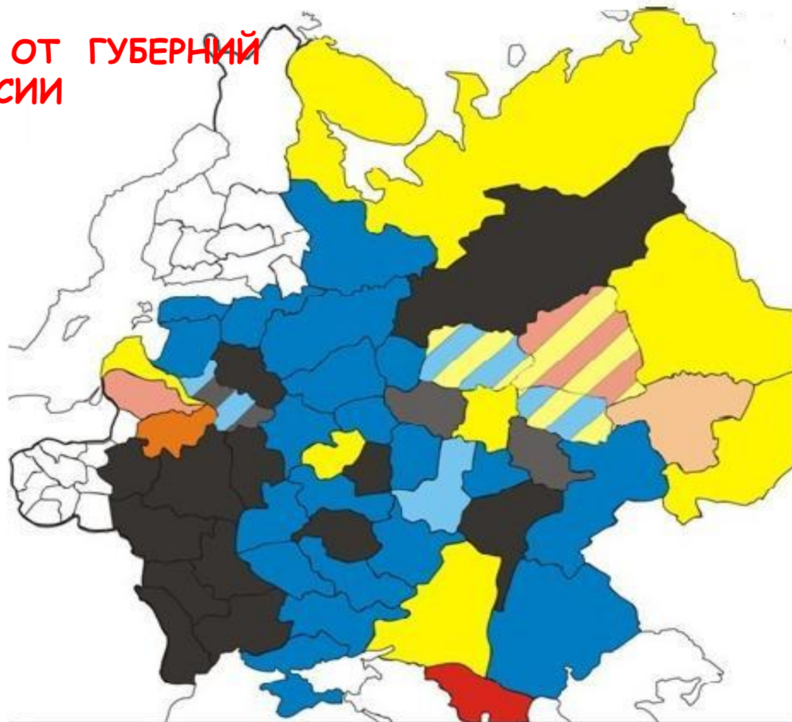
Члены III Думы от губерний Европейской России.