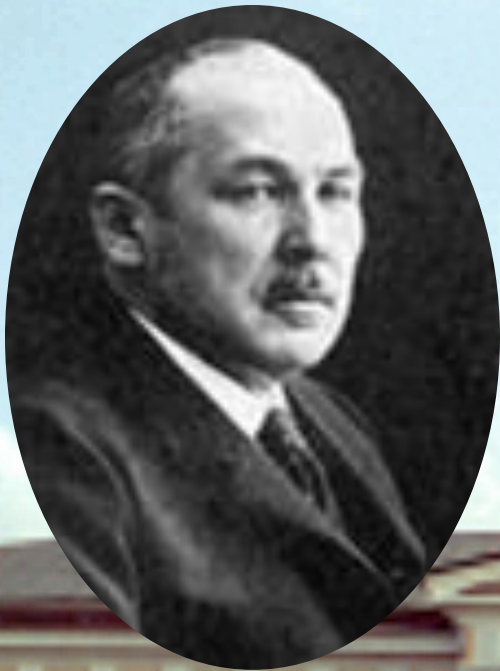
Н.А. Хомяков (октябрист) с 1 ноября 1907 г. по 4 марта 1910 г.