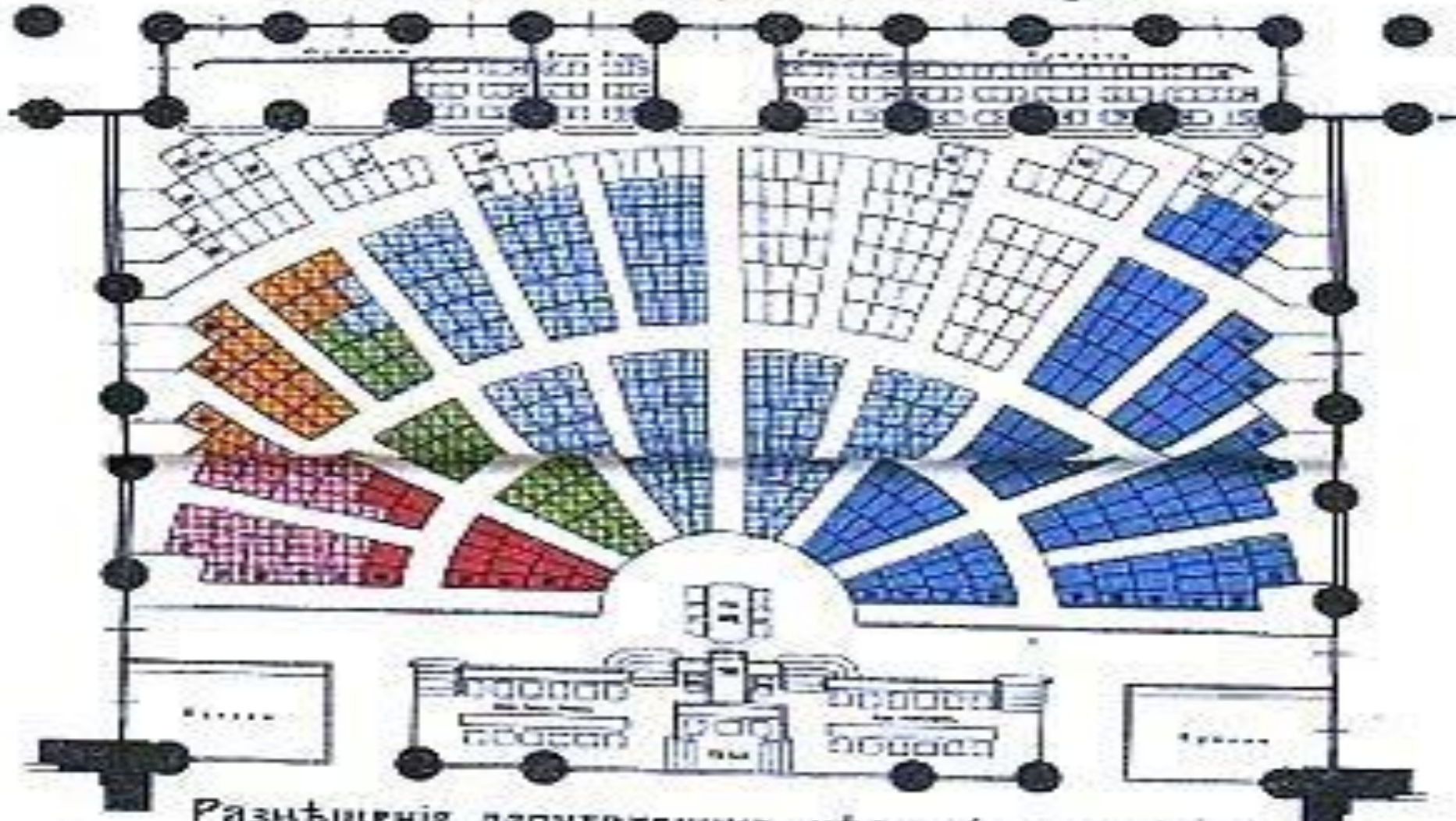
Размѣщеніе депутатскихъ мѣстъ (по партіямъ).