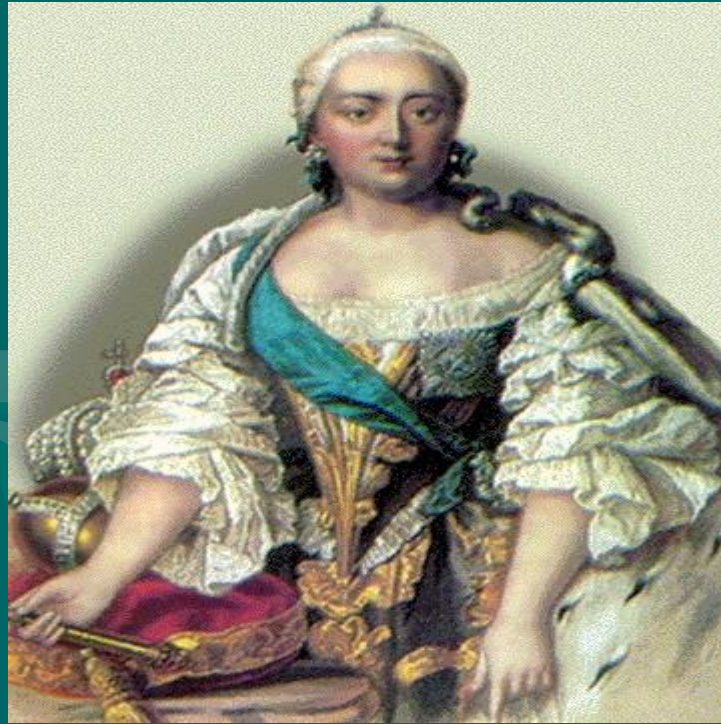
• Елизавета Петровна

В 1742 Петр был привезен в Россию и своей тетей императрицей Елизаветой Петровной провозглашен наследником престола.