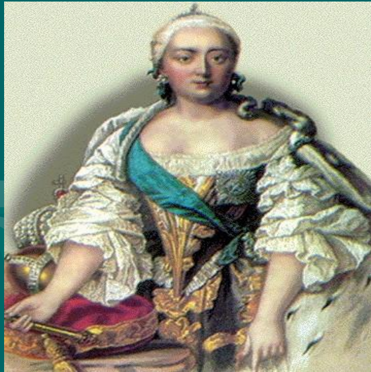
• Елизавета Петровна

В 1742 Петр был привезен в Россию и своей тетей императрицей Елизаветой Петровной провозглашен наследником престола.