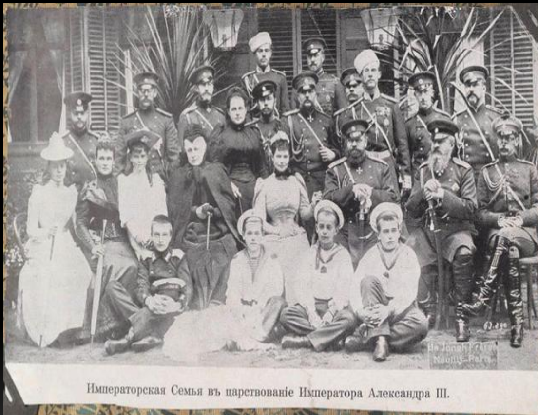
Императорская Семья въ царствованіе Императора Александра III.

Императрица Мария Феодоровна провела в России более 50 лет, пережила революцию, стоившую жизни двум ее сыновьям и пяти внукам.