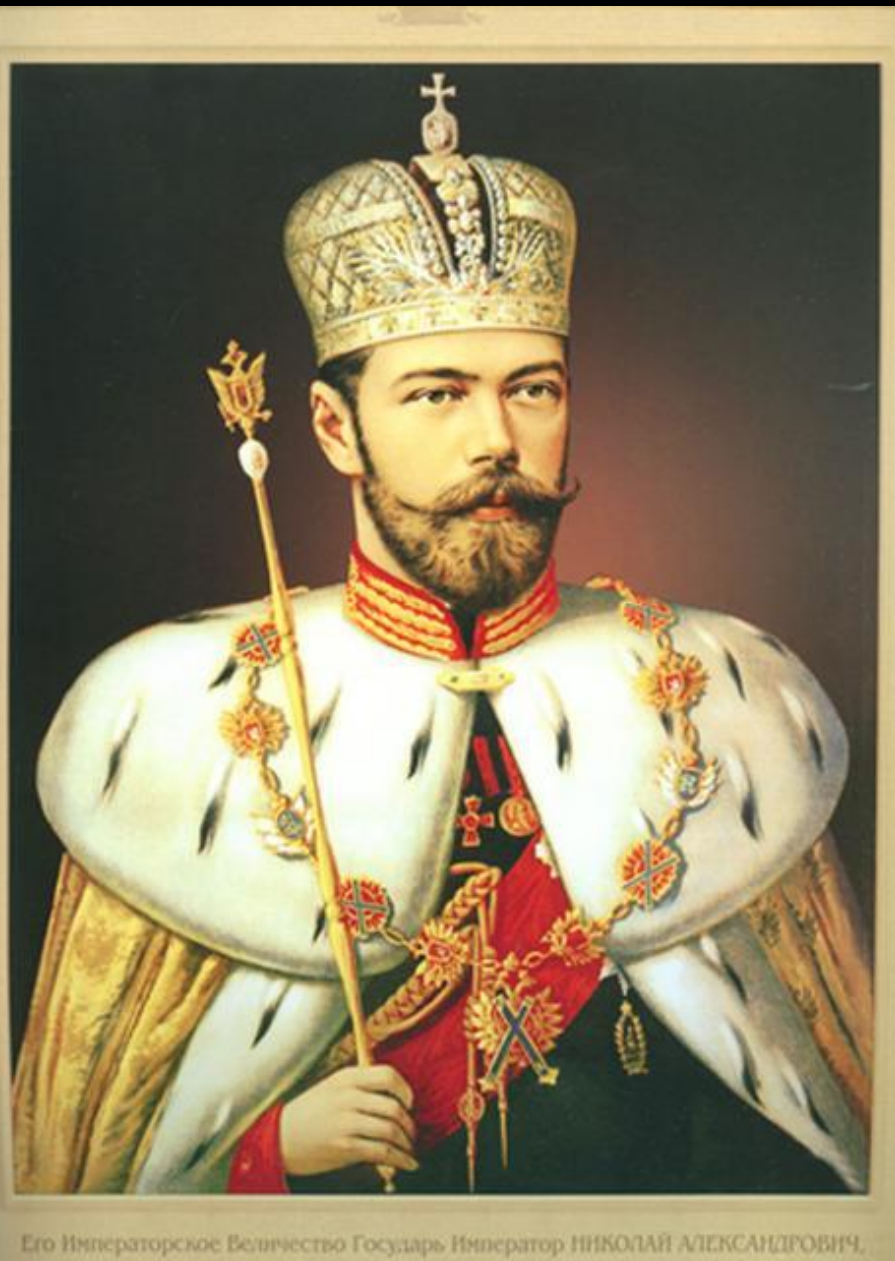
Его Императорское Величество Государь Император НИКОЛАЙ АЛЕКСАНДРОВИЧ.

На престол вступил император Николай II. Вдовствующая императрица нередко относилась критически к политике своего сына, но не стремилась оказывать прямого влияния на государственные дела.