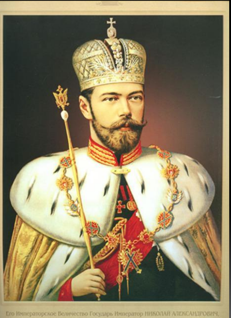
Его Императорское Величество Государь Император НИКОЛАЙ АЛЕКСАНДРОВИЧ.

На престол вступил император Николай II. Вдовствующая императрица нередко относилась критически к политике своего сына, но не стремилась оказывать прямого влияния на государственные дела.